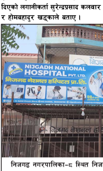
निजगढ नगरपालिका-८ स्थित निजगढ नेशनल हस्पिटल ।