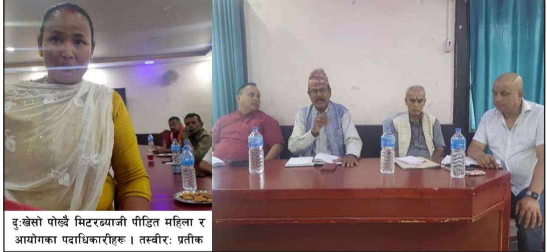
दुःखेसो पोख्रै मिटरब्याजी पीडित महिला र आयोगका पदाधिकारीहरू ।