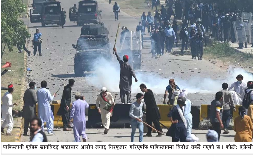
पाकिस्तानी पूर्वप्रधानमन्त्री इमरान खानलाई गिरफ्तार गरिएको छ।

इस्लामाबाद, २८ वैशाख/एनआई/सिन्हा पूर्वप्रधानमन्त्री इमरान खानलाई गिरफ्तार गरेपछि पाकिस्तानभर भएका विभिन्न झडपमा कम्तीमा आठजनाको मृत्यु भएको छ। ती झडपमा २९० भन्दा बढी घाइते भएको पनि उनले बिहीवार उल्लेख गरेको छ।