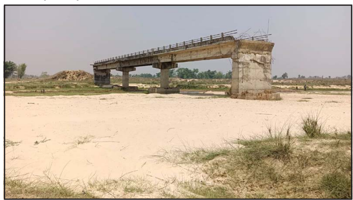
थरुहट सडकखण्ड अन्तर्गत पटेवाँसुगौली र जीराभवानी गापाको दोस्रोध भएर

जीतपुर-रङ्गपुर-शङ्करसरैया अर्थात् २०६७/६८ मा सडक डिभिजनले निर्माण