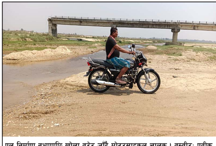
पुल निर्माण नभएपछि खोला तरेर जाँदै मोटरसाइडल चालक।