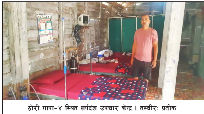
ठोरी गापा-४ स्थित सर्पदंश उपचार केन्द्र।