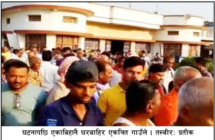
घटनापछि एकाबिहानै घरबाहिर एकत्रित गाउँले ।

गरी सबै लकर तोडेको, आफूसँग डेढ घण्टासम्म बहस गरी कुटपिट गरेको बताए । उनले डाँकाहरूसँगको बहसमा