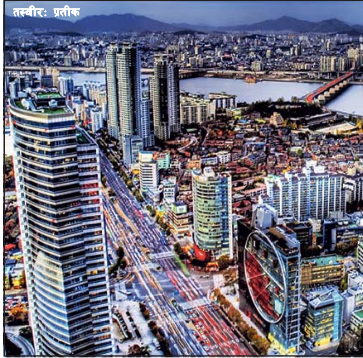
सियोल, ८ वैशाख / सिन्धुवा

दक्षिण कोरियाली आपूर्तिकर्ताहरूबीचको वस्तु तथा सेवाको