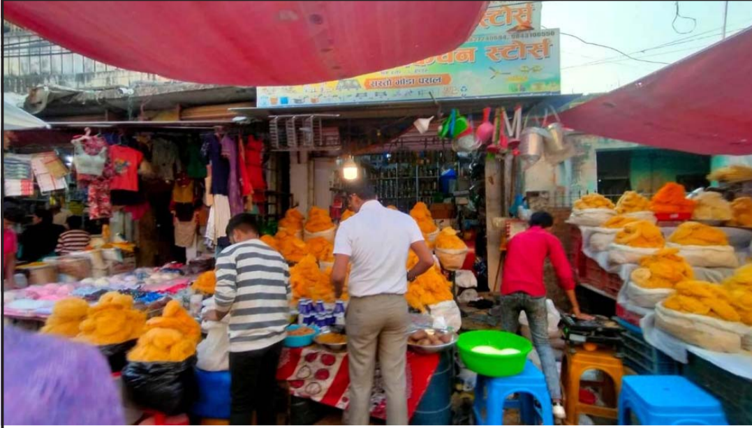
मुस्लिम देश पाकिस्तान, अफगानिस्तान, साउदी अरब, दुबई, कतार, कुवैत आदिमा शुक्रवार इद पर्व मनाइयो भने नेपालमा शनिवार मनाइँदछ। यसै क्रममा वीरगंजको मीनाबजारमा इदको लागि सेवई बिक्री गर्दै पसले।