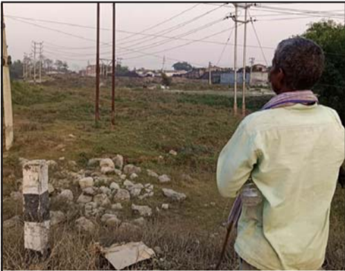
उद्योगले फालेको फोहर देखाउँदै।

खोलालाई प्रदूषित पार्ने कार्य गरेको गुनासो गरेका छन्।