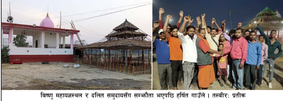
विष्णु महायज्ञस्थल र दलित समुदायसँग सम्बन्धिता भएपछि हर्षित गाउँले ।

वीरगंज-१७ अनाँमा सम्पन्न महायज्ञमा पनि दलित सहभागिता गराइएको थिएन ।