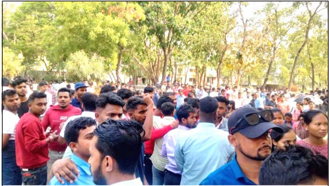
प्रवेशपत्र लिन गएका विद्यार्थीहरू अलपत्र अवस्थामा ।