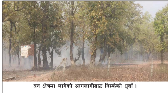
वन क्षेत्रमा लागेको आगलागीबाट निस्केको धुँवाँ।

यसका साथै जङ्गलमा लागेको डढेलो र छवाली टूटोमा लागेका आगोका कारण निस्केको धुँवाँका कारण वातावरण नै दूषित भएको छ। हावामा बाक्लो धुँवाँ भएका कारण मानव जीवनको स्वास्थ्यमाथि नकारात्मक असर परिरहेको छ। दूषित वातावरणका कारण बिहान हुस्सु लागेजस्तो धुँवाँले ढाकिएको देखिन्छ। जसले गर्दा आँखा पोल्ने, आँखा पाकेर सुनिने, रातो हुने तथा छालामा विभिन्न किसिमका चर्मरोग लाग्ने गरेको स्थानीयले गुनासो गरेका छन्।