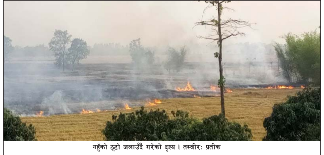
गहुँको टूटो जलाउँदै गरेको दृश्य।

राष्ट्रिय निकुञ्ज तथा मध्यवर्ती क्षेत्र सामुदायिक वन क्षेत्रमा लागेको डढेलो अन्तर्गत रहेको राष्ट्रिय वन तथा पनि नियन्त्रण हुन सकेको छैन।