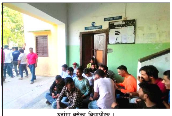
धर्नामा बसेका विद्यार्थीहरू ।

आएकोमा आपत्ति जनाउँदै आएका थिए । उनीहरूले ठाराब क्याम्पसका विद्यार्थीहरू