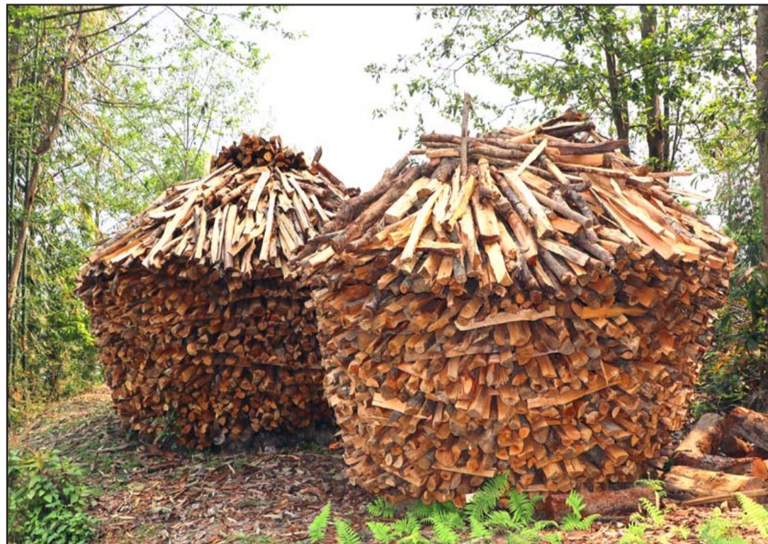
बाउराको कुन्यु: सङ्खुवासभाको अरुणथानका स्थानीयवासीले बर्खाका लागि कुन्यु लगाएर जोहो गरेका बाउरा। बाउरा ग्रामीण भेगमा खाना पकाउन प्रयोग गरिन्छ।

५१ देखि १०० सम्म एक्युआई मापन गरिएको वायु सामान्य अवस्थाको मानिन्छ। त्यसभन्दा माथिको एक्युआई अस्वस्थकर हुन्छ। एक्युआई तीन सयभन्दा माथि पुगेमा वायु प्रदूषण डरलाग्दो र घातक हुने बताइएको छ।