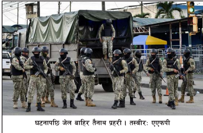
घटनापछि जेल बाहिर तैनाथ प्रहरी।

मुलुक कोलम्बिया र पेरूको बीचमा अवस्थित ग्वायाकिल हालैका वर्षमा लागू औषध तस्करीको केन्द्रबिन्दु बनेको छ।