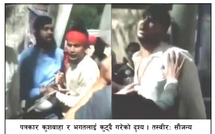
पत्रकार कुशवाहा र भगतलाई कुटिँदै गरेको दृश्य ।

अनुसन्धान भइरहेको बताएको छ । एक सातादेखि यादवले तस्करीको