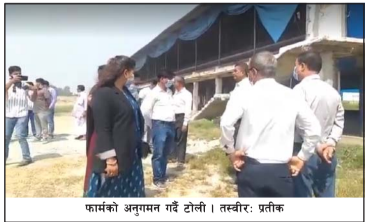
फार्मको अनुगमन गर्दै टोली ।

यसरी एक आवमा जम्मा रु १८ लाख ३२ हजार ४६० रुपियाँको इन्धन खर्च हुन आउँछ । तर अधिकृत साहले दाबी गरे अनुसार इन्धनमा खर्चको कुल रु ४२ लाख ४२ हजार ३७४ मध्ये २४ लाख नौ हजार ९१४ रुपियाँ जेसिबीको इन्धनमा मात्रै खर्च भएको देखाएर इन्धनमा व्यापक अनियमितता भएको देखिन्छ ।