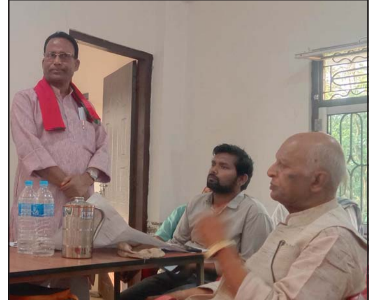
बैठकमा छलफल गर्दै पोखरिया नपाका प्रमुख चौहान (बायाँ)लगायत।

४१ वर्षदेखि जग्गाधनी मर्कामा रहेका कुरालाई मध्यनजर गर्दै सोको कार्यान्वयन गर्न सबै राजनीतिककर्मी,