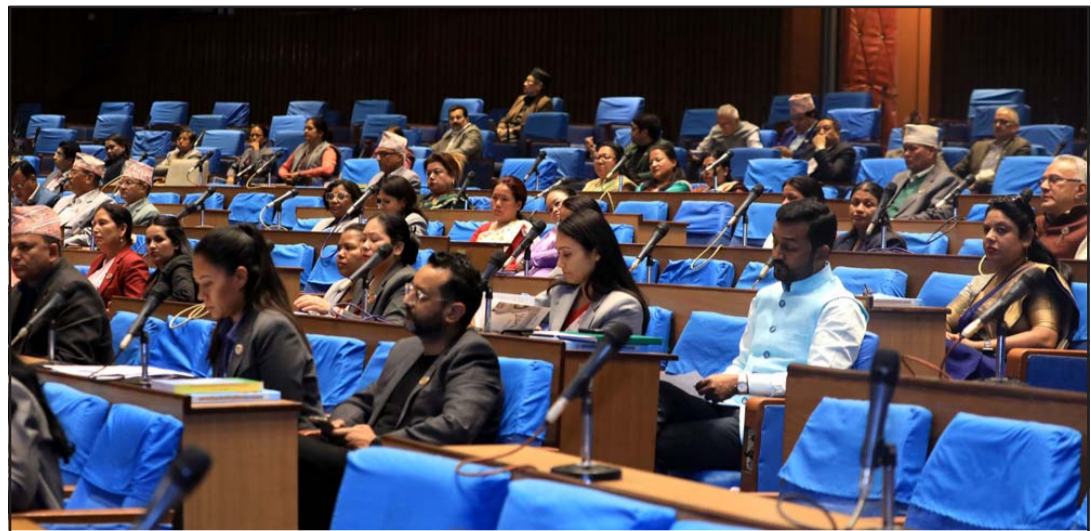
प्रतिनिधिसभाको बुधवार बसेको बैठकमा सहभागीहरू।

‘सुरक्षण मुद्रणसम्बन्धी विधेयक, २०७७ माथि विचार गरियोस्’ भन्ने प्रस्ताव कार्यसूचीमा समावेश गरिए पनि प्रतिनिधिसभामा गणपूरक सङ्ख्याको अभावमा प्रस्ताव प्रस्तुत हुन सकेन।