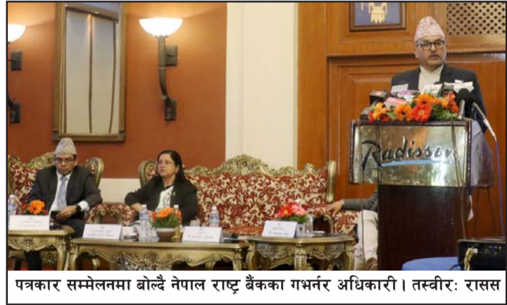
पत्रकार सम्मेलनमा बोल्दै नेपाल राष्ट्र बैंकका गभर्नर अधिकारी।

वस्तुगत आधारमा पेट्रोलियम पदार्थ, (बाँकी चौथो पातामा)