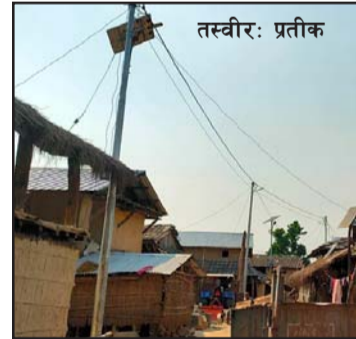
सेवा सञ्चालन भएको छ। ऊर्जा मन्त्रालयको रु एक करोड

हो र यहाँ खानेपानी, शिक्षा, स्वास्थ्यलगायतका समस्या अहिले पनि विद्यमान छन्।