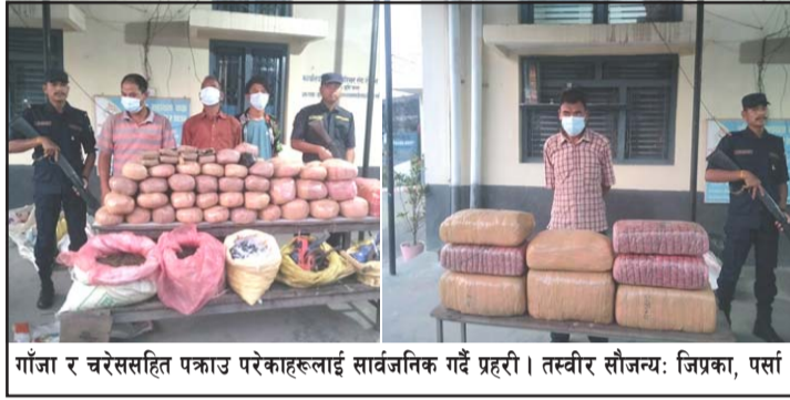
गाँजा र चरेससहित पक्राउ परेकाहरूलाई सार्वजनिक गर्दै प्रहरी।

पर्सा जिल्लामा लागूऔषध गाँजा, चरेसको कारोबार लामो समयदेखि हुँदै आएको छ। करीब डेढ दशकअघिसम्म