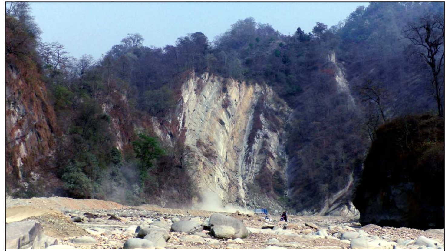
विश्वको कान्छो चुरे पर्वत श्रृङ्खला जोगाउन अवैज्ञानिक ढङ्गबाट जथाभावी नदीजन्य पदार्थको उत्खनन दोहन बन्द गर्नु पर्दछ।