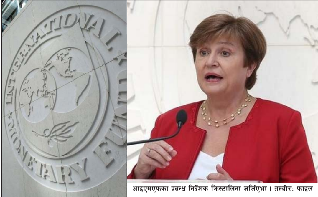
आइएमएफका प्रबन्ध निर्देशक क्रिस्टालिना जर्जिएभा।

जलवायु परिवर्तनका कारण उत्पन्न हुने सङ्कट नियन्त्रण गर्न धेरै काम गर्न