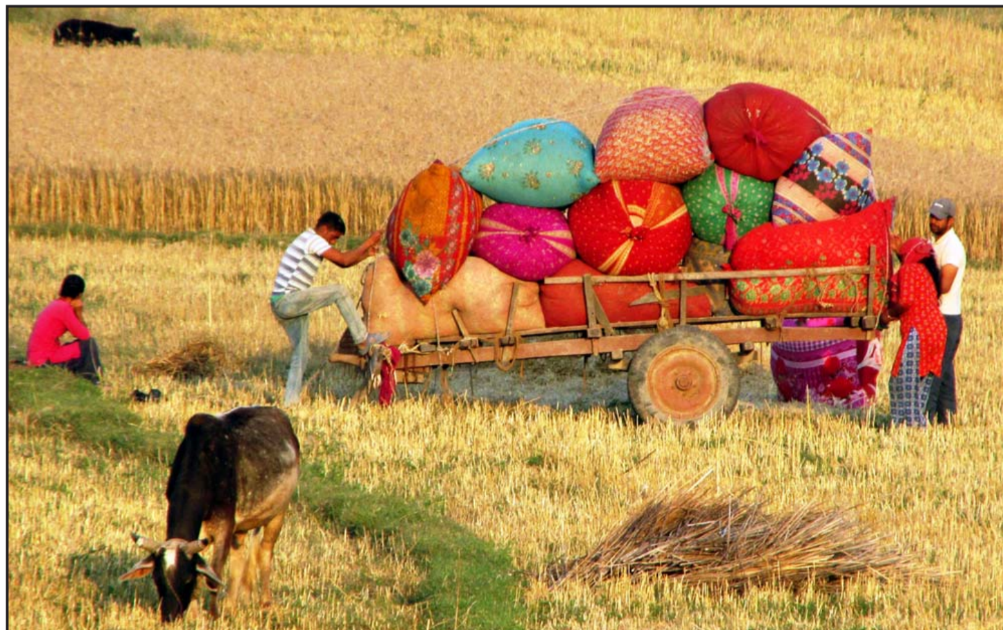
गहुँको मुस लैजाने तयारी : शुक्लाफाटी नगरपालिका-२ का किसान सेतमा गहुँ शेसिड जारी निस्केको मुस जोरु जाडामा राखेर घर तर्फ लैजाने तयारी गर्दै। गहुँको मुस अणुकरण जारी किसानले पछि पशु चौपायाँलाई घाँससँगै मिसाएर खुवाउने गर्दछन्।

आज कारोबार रकमका आधारमा सबैभन्दा धेरै शिवम् सिमेन्ट लिमिटेडको र सात करोड १० लाख ९३ हजार बराबरको कारोबार भएको छ। कारोबार भएका शेयर सङ्ख्याका आधारमा भने सबैभन्दा धेरै प्रभु बैंक लिमिटेडको एक लाख ८७ हजार ५९४ किता शेयर किनबेच भएको छ।