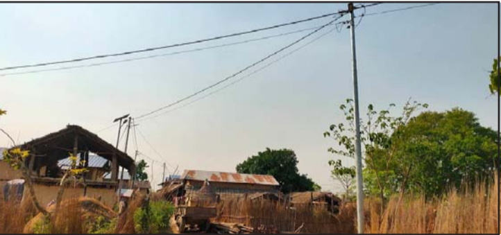
स्थानीय खुशी भएका छन्। उनीहरूले भर्खरै गापाले सञ्चालनमा