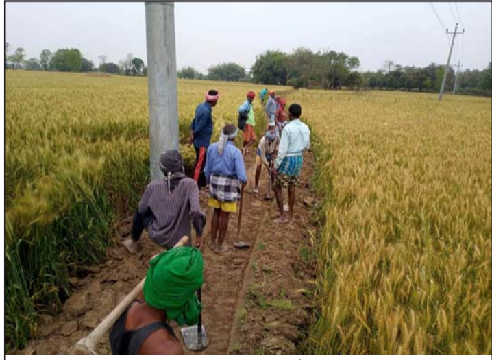
प्रधानमन्त्री रोजगार कार्यक्रम अन्तर्गत कार्य गर्दै मजदुरहरू।

जगरनाथपुर गापाका प्रमुख प्रशासकीय अधिकृत कृष्णानन्दनराय