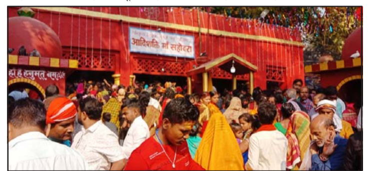
पहिलो बलि दिइने उनले बताए। यी परिवारका अधिकांश सदस्य मङ्गलवार