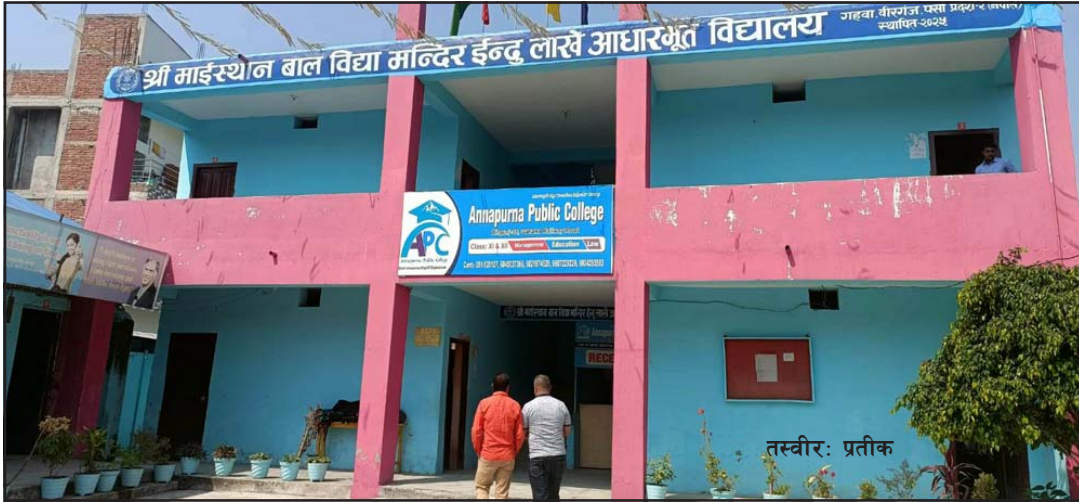
माईस्थान बाल विद्यामन्दिर इन्दु लाखे आधारभूत विद्यालयमा कक्षा ८ को आधारभूत तहको परीक्षा दिइरहेका

चारवटा संस्थागत विद्यालयका ८२ जना विद्यार्थीको उत्तरपुस्तिका नियन्त्रणमा अनधिकृत रूपमा परीक्षा दिइरहेका थिए । महानगरपालिकाका शैक्षिक