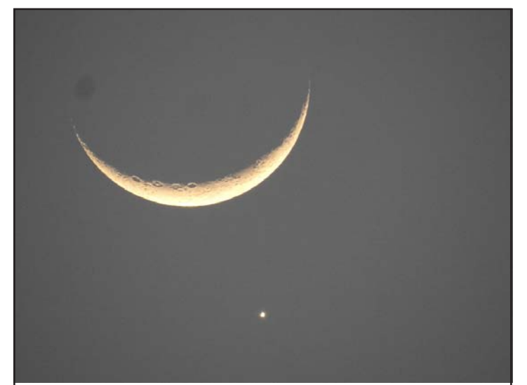
अर्धाकार चन्द्रमाको दृश्य : रमजानको पवित्र महीनामा महेन्द्रनगरबाट देखिएको अर्धाकार चन्द्रमाको दृश्य।

नेपाल र भारतको हकमा 'बुखारे शरीफ' (भारतको दिल्लीस्थित सांस्कृतिक