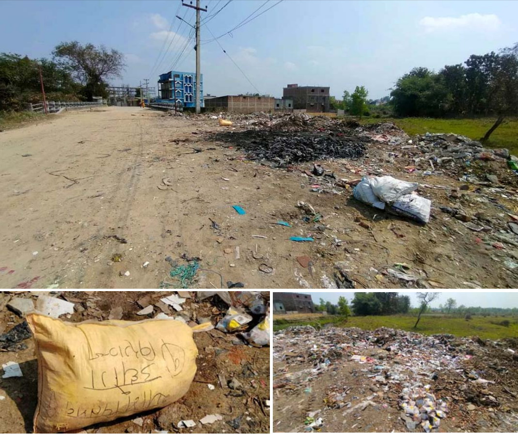
सडकमा फालिएको फोहोर ।

रहेका उद्योग सञ्चालकहरूका कारण अहिले वडा नं २५ श्रीसिया जाने पुलदेखि पश्चिमतर्फको बाटो फोहोरको डङ्गुरले दुर्गन्धित भएको छ ।