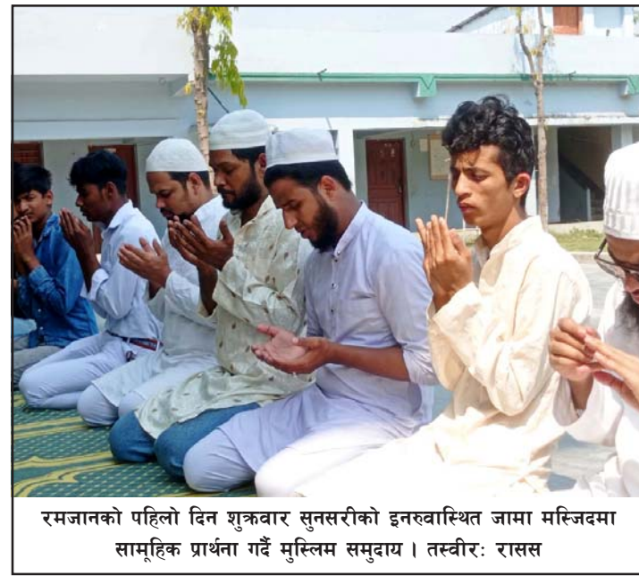
रमजानको पहिलो दिन शुक्रवार सुनसरीको इन्डुवास्थित जामा मस्जिदमा सामूहिक प्रार्थना गर्दै मुस्लिम समुदाय।

अन्त्य हुनुसँगै बिहीवार साँझ चन्द्रमा देखिएपछि इस्लाम धर्मगुरु मौलवी, मौलानाले तत्कालै 'तराबी' नमाज (प्रार्थना) गरेर यस वर्षको रमजान अब शुरू भएको बताएका हुन्। 'सवान' महीना सकिनासाथ पहिलोपटक चन्द्रमा देखिएपछि तत्काल 'तराबी' नमाज (विशेष प्रार्थना) गरेर भोलिपल्टदेखि रमजान शुरू हुने इस्लाम परम्परा छ। सो अनुसार बिहीवार साँझ 'तराबी' सम्पन्न गरेका इस्लाम धर्मावलम्बीले आज 'रोजा' शुरू गरेका हुन्।