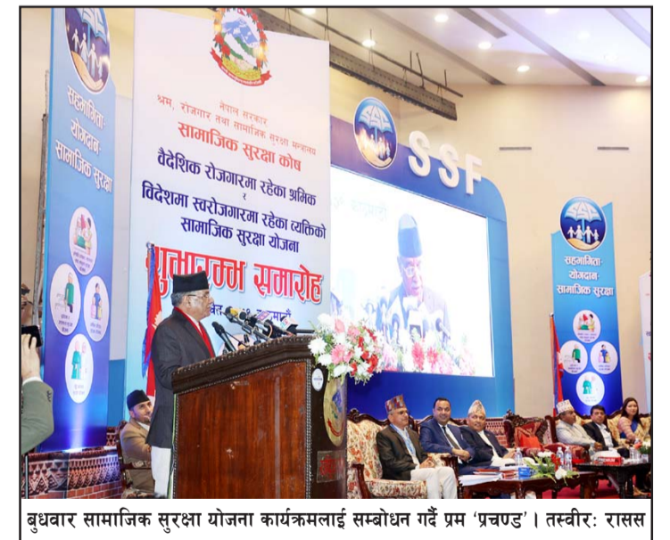
बुधवार सामाजिक सुरक्षा योजना कार्यक्रमलाई सम्बोधन गर्दै प्रेम 'प्रचण्ड' ।

लुम्बिनी प्रदेशबाट १४ हजार ९९, सुदूरपश्चिम प्रदेशबाट एक हजार ५२९ र कर्णाली प्रदेशबाट एक हजार २२८