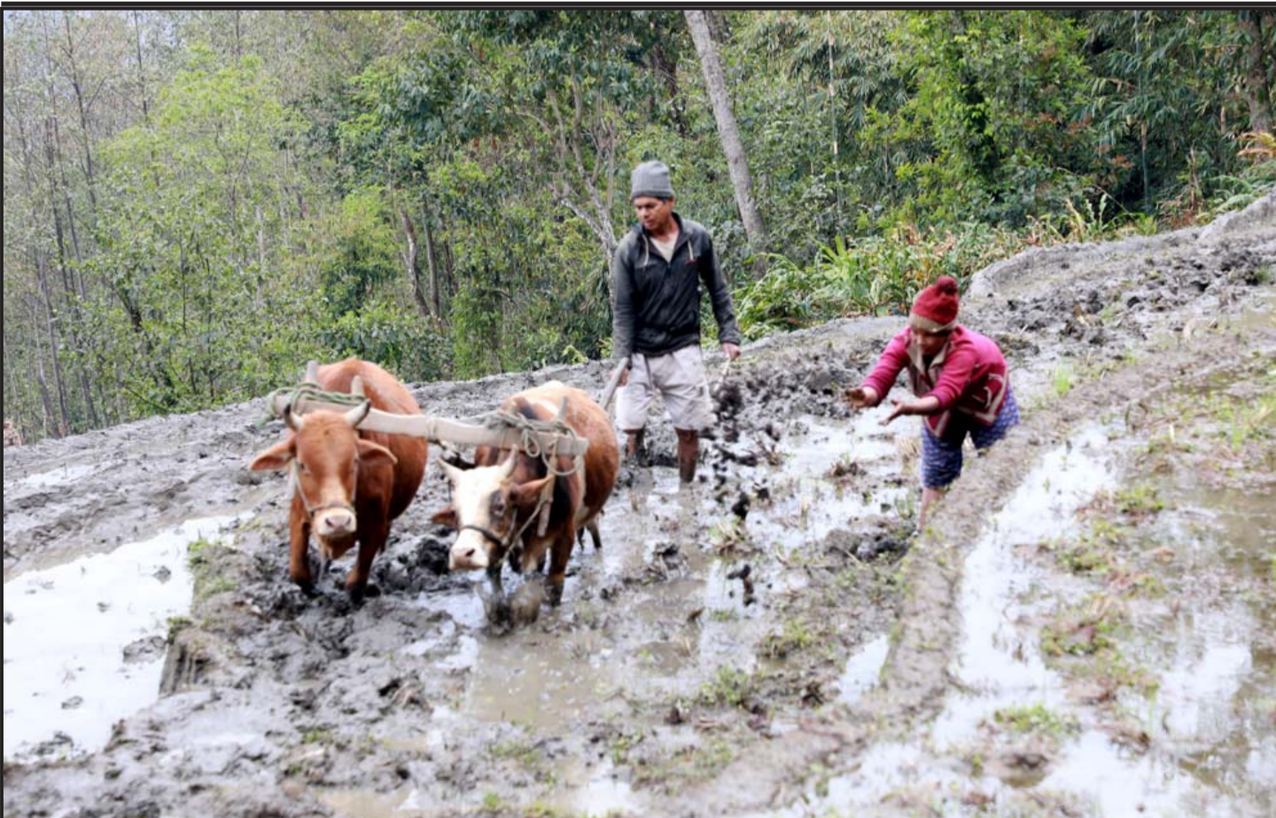
चैते धानका गोरु जोट्दै : संखुवासभा जिल्लाको धर्मदेवी नपा- ४ छुमुडमा चैते धान रोप्नका लागि गोरुमाफत् खेत जोट्दै कृषक परिवार । यस क्षेत्रमा वर्षको दुईपटक धान रोप्ने गरिन्छ ।

उदाहरणका लागि कुनै खास क्षेत्रको, कृषिको लागि मौसम र माटो अनुकूल हुनु, फराकिलो वन क्षेत्र हुनु, ठूला-ठूला तलाउ वा पोखरी हुनु, ठूला-ठूला नदीहरू हुनु, ऐतिहासिक महत्त्वको स्थान हुनु । प्रचीन बस्ती हुनुजस्ता कुरालाई स्थानीय स्रोत एवं साधनको रूपमा लिन सकिन्छ