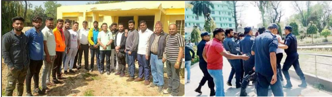
तालाबन्दी खुलाउन बसेको बैठकका सहभागीहरू र विवाद साम्य पार्न प्रयास गर्दै प्रहरी।

क्याम्पस प्रशासनले त्रिविविलाई चैत मसान्तमा स्ववियु निर्वाचनको लागि सिफारिश गर्ने भएको छ। तर त्रिविविले