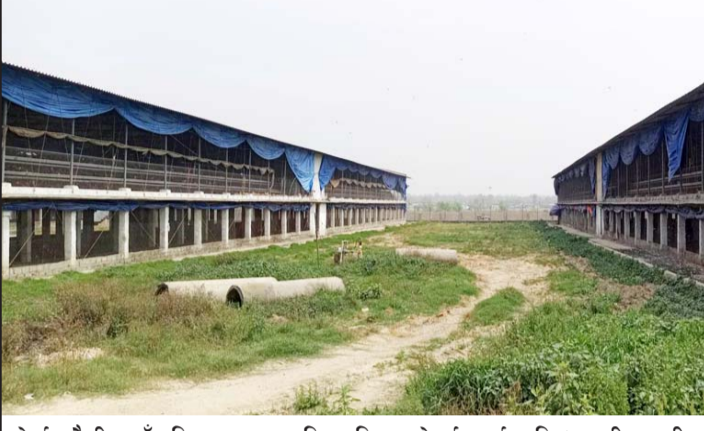
पटेवासुगौली गाउँपालिका-२ रङ्पुरस्थित शिवम् लेयर्स फार्म प्रालि।