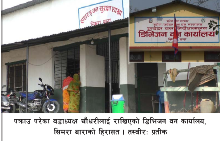
पक्राउ परेका वडाध्यक्ष चौधरीलाई राखिएको डिभिजन वन कार्यालय, सिमरा बाराको हिरासत।

संलग्न रहेको भन्दै उनलाई पक्राउ गरी अनुसन्धान भइरहेको वन कार्यालयले जनाएको छ।