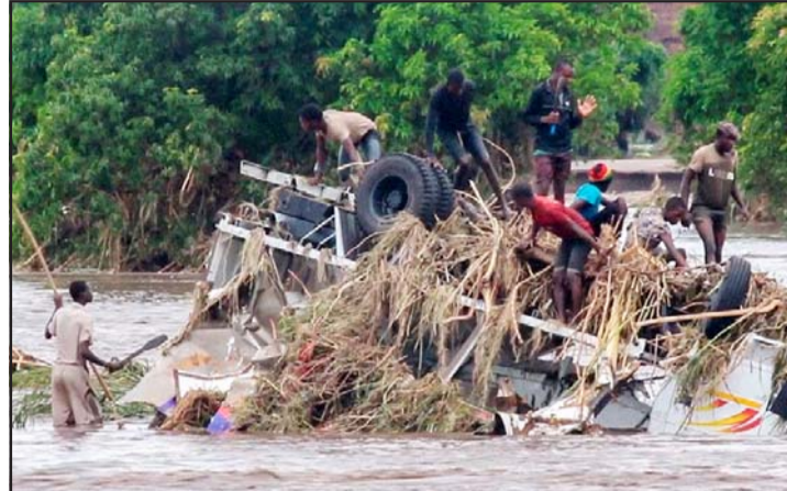
चक्रवात फ्रेडीबाट प्रभावित दक्षिण मलावी क्षेत्र ।

साथै संयुक्त अधिराज्यको सहयोगमा देशको सुरक्षा बल, प्रहरी र उद्धारकर्मीको टोलीले खोज तथा उद्धारलाई जारी राखेका छन् । सडक सम्पर्कबाट विच्छेद भएका स्थानमा हवाईसेवामार्फत राहत सामग्री, औषधिका साथै उद्धारकर्मी पुऱ्याइएको छ ।