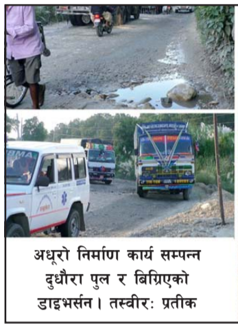
अधुरो निर्माण कार्य सम्पन्न दुधौरा पुल र बिग्रिएको ड्राइभर्सन ।