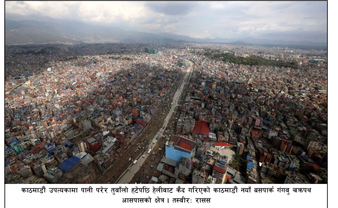
काठमाडौं उपत्यकामा पानी परेर त्रिवेणी हट्टेपछि हेलीवाट कैद गरिएको काठमाडौं नयाँ बसपार्क गंगवु चक्रपथ आसपासको क्षेत्र ।

आन्तरिक राजस्व उपसमिति, भन्सार उपसमिति, उद्योग वाणिज्य, लगानी तथा निर्यात प्रवर्द्धन उपसमिति, राजस्व चुहावट नियन्त्रण तथा सम्पत्ति शुद्धीकरण अनुसन्धान उपसमिति, कृषि, ऊर्जा तथा पर्यटन उपसमिति, बैंक, वित्तीय संस्था, बीमा, सहकारी तथा पूँजीबजार उपसमिति, गैरकर उपसमिति, अन्तरसरकारी राजस्व व्यवस्थापन उपसमिति, राजस्वसम्बन्धी ऐन नियम प्रशासनिक सुधार उपसमिति छन् ।