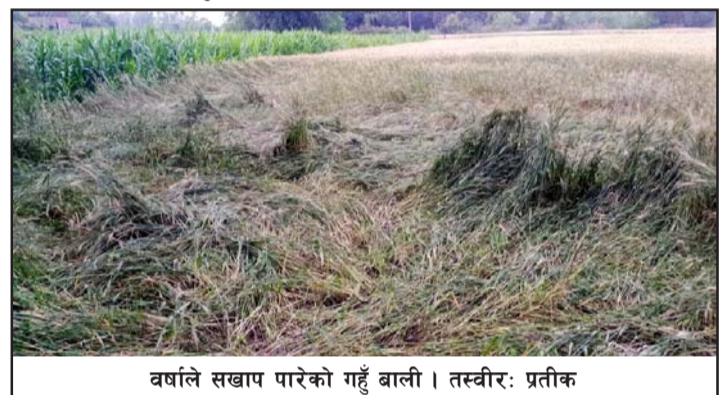
वर्षाले सखाप पारेको गहुँ बाली।

पानीले मुसुरो खेती गरेका किसानहरूलाई पनि समस्या पारेको छ। मुसुरो खेतीका लागि पानी विष सरह हुने गरेको छ। अहिले दलहनमा मुसुरो केही किसानहरूले भित्र्याउने बाँकी छ। पानी परेपछि मुसुरो खेती गरेका किसानहरूलाई समस्या भएको बताइन्छ।