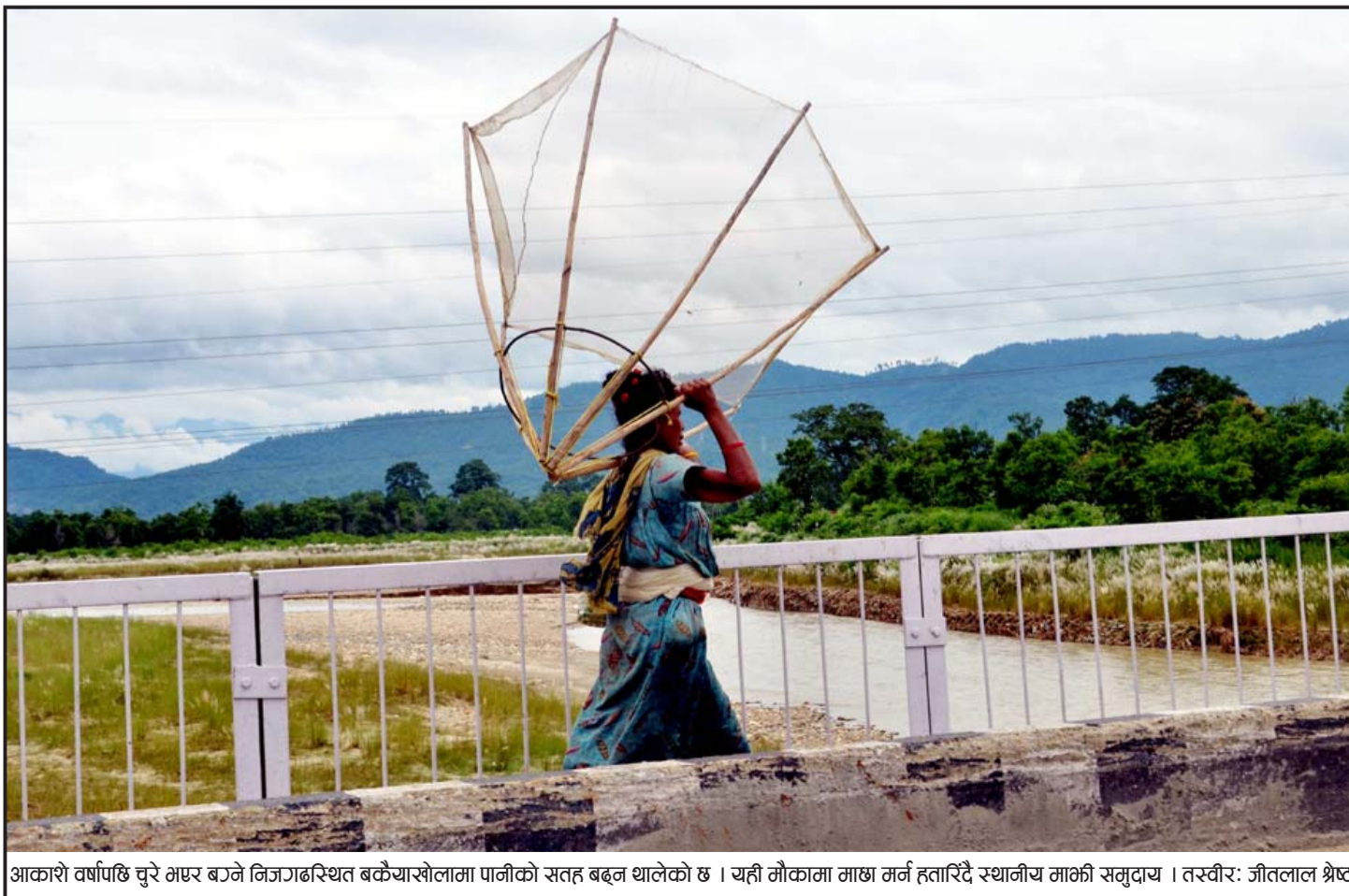
आकाशे वर्षापछि चुरे अण्डर बाने निजगढस्थित बकैयाखोलामा पानीको सतह बढ्न थालेको छ । यही मौकामा माछा मर्न हतारिँदै स्थानीय माछी समुदाय ।

पर्यटन विभागका अनुसार वसन्त ऋतुमा हिमाल आरोहणका लागि यतिखेर विभिन्न मुलुकका आरोहीले धमाधम आरोहण अनुमति लिइरहेका छन् ।