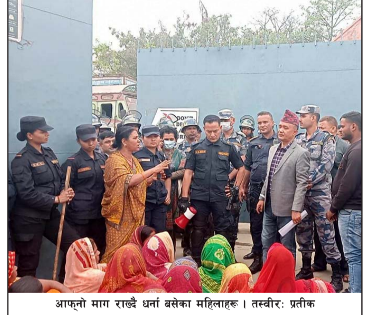
आफ्नो माग राख्दै धना बसेका महिलाहरू ।

घडैरीको जग्गाको नापजोख र यकीन गर्न अहिले बाँकी छ । एकातिर मुआवजा पनि नपाउने