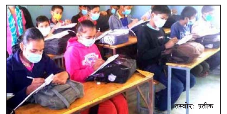
बुधवारदेखि सञ्चालन हुने गापा कार्यालयले जनाएको छ। सखुवाप्रसौनी गापालमा भने कक्षा ८ को आधारभूत परीक्षासहित वार्षिक परीक्षा चैत ८ गतेदेखि सञ्चालन हुने गापा कार्यालयले जनाएको छ।

आइतवारदेखि नै सञ्चालन भएका छन्। धोबिनी गापालमा कक्षा ८ को आधारभूत परीक्षा लङ्डी माविमा एकमात्र परीक्षा केन्द्र तोकिएको सञ्चालन भइरहे पनि कक्षा १ देखि कक्षा ७ र कक्षा ९ को वार्षिक परीक्षा हुन सकेको छैन। वार्षिक परीक्षाका लागि अहिलेसम्म यो पालिकाले कार्यतालिका सार्वजनिक गर्न सकेको छैन। ठोरी गापाका सामुदायिक विद्यालयहरूमा भने कक्षा ८ को आधारभूत परीक्षा भोलि चैत ७ गते मङ्गलवारदेखि सञ्चालन हुन गइरहेको छ। बाँकी कक्षाका साथै कक्षा ११ र १२ को दोस्रो त्रैमासिक परीक्षा ८ गते