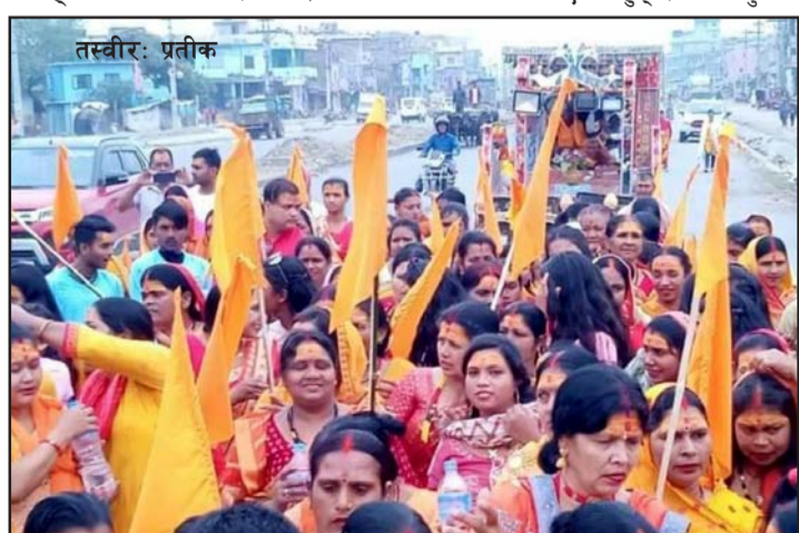
अष्टयाम शुरू भएको छ। आफ्नो मृत्युपश्चात् आफ्नो सम्पत्तिबाट अष्टयाम लगाउन इच्छा जाहेर गरेको

राउतले स्वर्गीय आमा, बुबाको इच्छानुसार पैतृक सम्पत्ति बिक्री गरेर अष्टयाम लगाएका हुन्। आमाबुबाले