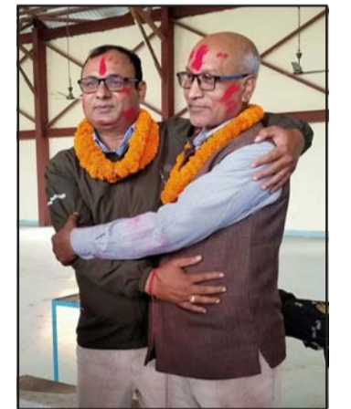
लागि सातजना र प्रदेश प्रतिनिधिहरूमा आठजना प्रतिनिधिहरू चयन गरेको जनाएको छ।