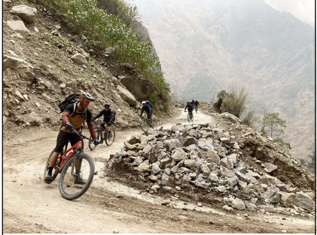
मनाइमा विदेशी साइकलयात्री : अन्नपूर्ण पदमार्गमा पर्यटनको चहलपहल बढिरहेको बेला विदेशी साइकलयात्री मनाइमा। नासो गाउँपालिका-१ त्थ्याडी भिरको सडकमा साइकलमा मनाइ जाँदै गरेको दृश्य।

ऋणी केन्द्रित हुनुपर्छ।" उनले आफूहरूले पनि उद्यम गर्नेगरी तालीम प्रदान गर्नेलगायतका कार्यक्रम ल्याउने बताए। लघुवित्त संस्थाले ब्याजदर घटाउने, पारिवारिक सहमतिमा ऋण दिने, ऋण तिर्न ऋण नदिने, व्यावसायिक योजना बनाउनेलाई मात्र ऋण दिनेलगायतका काम गर्नुपर्ने तथा ऋणीले पनि व्यवसायमा लगानी गर्ने, ऋण लिएर फजुल खर्च नगर्ने र समयमै किस्ता र ब्याज तिर्नुपर्ने साथै ऋण लिएर ऋण तिर्ने परिपाटीको अन्त्य गर्ने सम्झौता भएको छ। यसमा स्थानीय तहले ऋणीलाई उद्यमशील बनाउन तालीम दिने, उत्पादित वस्तुको बजारीकरण गर्ने, सीपमूलक तालीम र औजार वितरण गर्नेगरी त्रिपक्षीय सहमति भएको हो। लघुवित्त संस्थाका प्रमुख तथा प्रतिनिधि र ऋणीले संयुक्त हस्ताक्षर गरेर धुकौटा गाउँपालिकामाफत नेपाल सरकारलाई समेत अनुरोध गरेका छन्। भेलामा उपस्थित ४० जनाले हस्ताक्षर गरेर लघुवित्त संस्थाका कानून संशोधन गर्ने, एक पालिकामा एक लघुवित्तले मात्र लगानी गर्ने, विपन्न परिवारलाई सस्तो दरमा ऋण दिने, लघुवित्तको अनुगमन स्थानीय तहलाई दिने, ग्रामीण क्षेत्रमा लगानीको ब्याजदर एक अङ्कमा झार्ने, प्राकृतिक प्रकोप र जटिल रोगबाट ग्रसित परिवारको ऋण मिनहा गर्नुपर्ने भन्दै ऋणी, लघुवित्त र गाउँपालिकाले संयुक्त अनुरोध गरेका छन्।