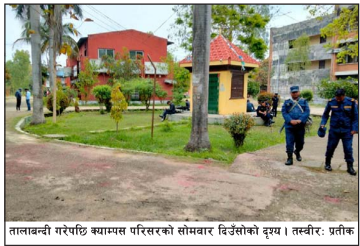
तालाबन्दी गरेपछि क्याम्पस परिसरको सोमवार दिउँसोको दृश्य ।

समितिको बैठकमा छलफलको विषय हुने उनले बताइन् ।