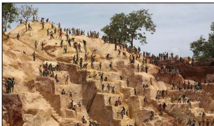
मध्य अफ्रिकी गणतन्त्रको बाम्बारीको उत्तरमा स्थित सुनको खानी।

घटनाको समयमै व्यवस्थापन गर्न, दोषीलाई कानूनबमोजिम कडा सजाय दिन