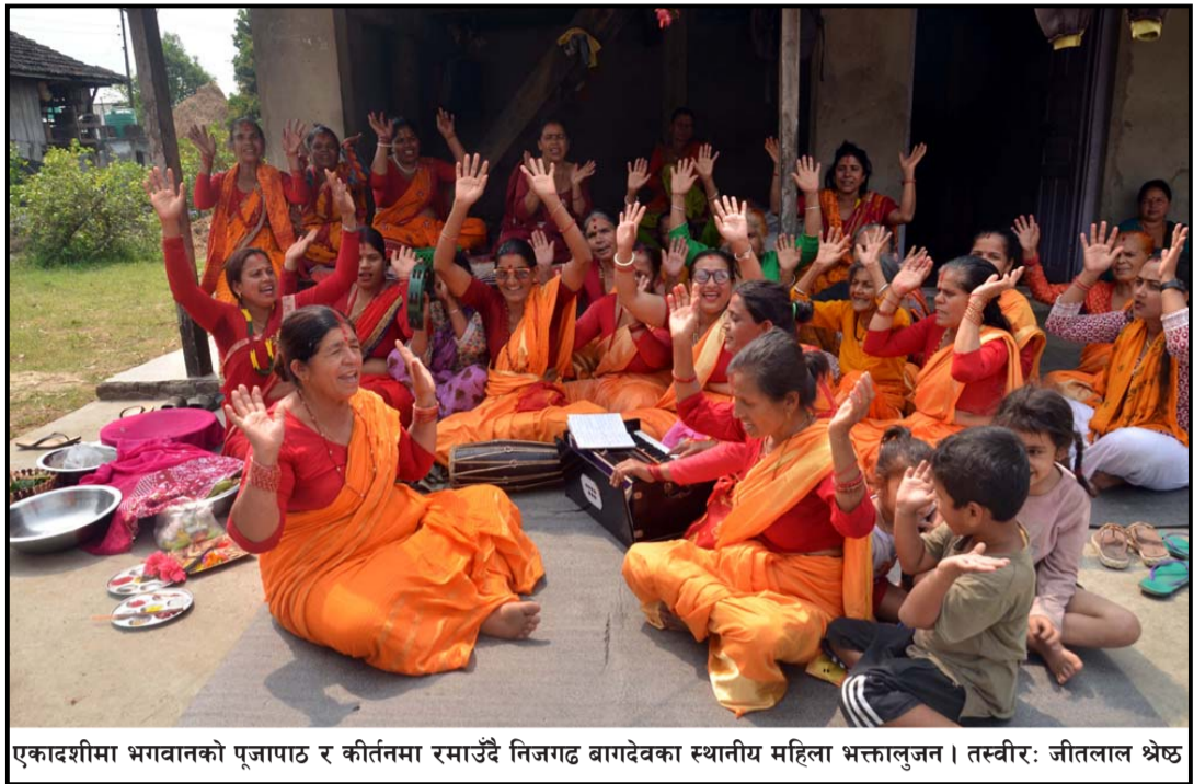
एकादशीमा भगवानको पूजापाठ र कीर्तनमा रमाउँदै निजगढ बागदेवका स्थानीय महिला भक्तालुजन्।

त्यस अघि पनि बाइडेन प्रशासनले युक्रैनमा मस्कोले युद्ध अपराध गरेको प्रमाण आफूसँग रहेको जनाउँदै मस्कोविरुद्ध अन्तर्राष्ट्रिय समुदायले आवाज उठाउनुपर्ने कुरामा जोड दिँदै आएको थियो। रासस