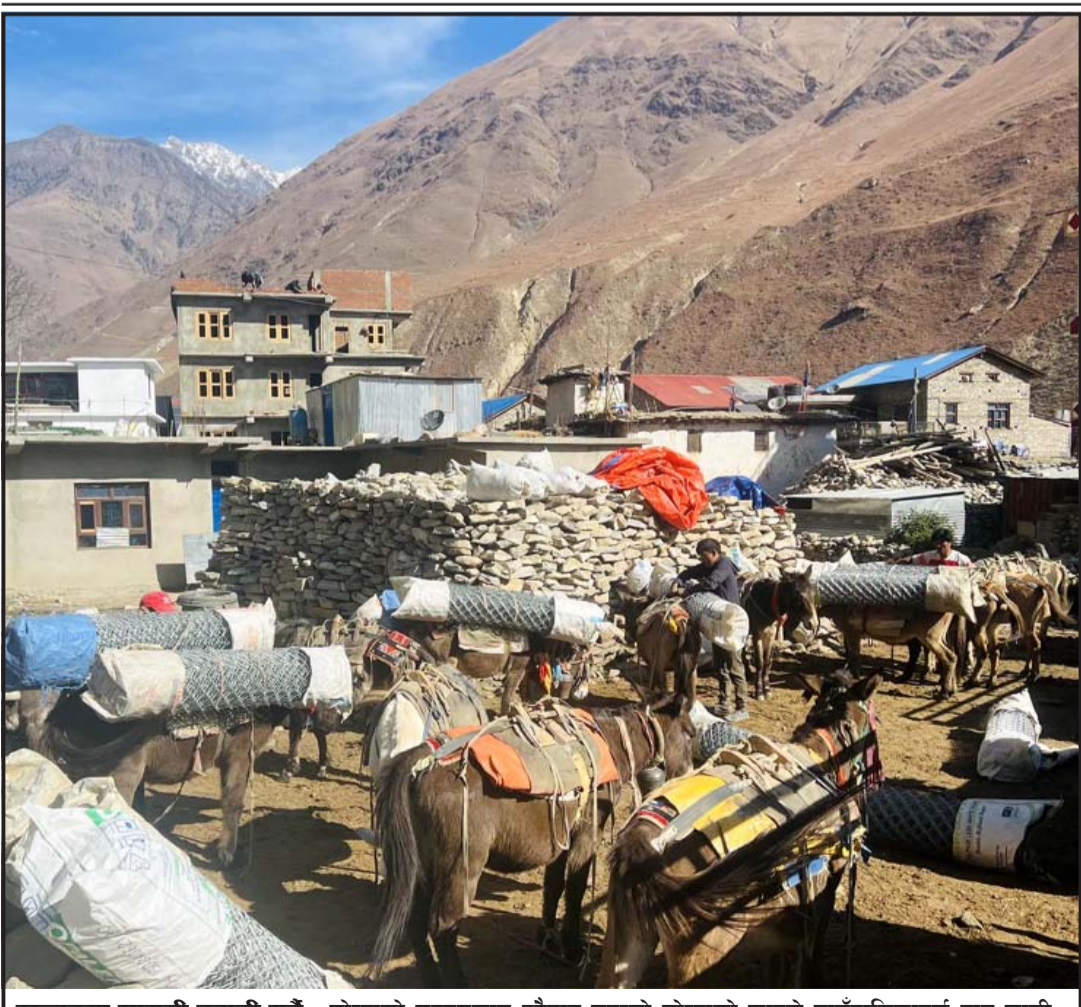
खच्चडमा सामग्री दुवानी गर्दै : डोल्पाको सदरमुकाम दुनैबाट उपल्लो डोल्पाको काइके गाउँपालिकातर्फ तार जाली दुवानी गर्न खच्चडमा राखिँदै। दुनैबाट काइके दुवानी गरेबापत प्रतिखच्चड र तीन हजार पर्दछ।

आयोगको सदस्यसचिवमा संस्कृति, पर्यटन तथा नागरिक उड्डयन मन्त्रालयका सहसचिव बुद्धिसागर लामिछाने छन्।