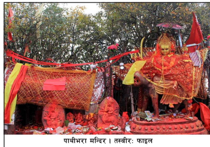
पाथीभरा मन्दिर ।

बलि चढाउँदा पशुका रगतले मन्दिर परिसर राताम्य हुने गरेकामा पछिल्लो समय सफा र सुन्दर देखिन्छ । रगतका