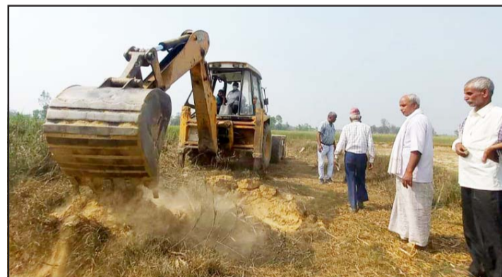
सार्वजनिक जग्गा आफ्नो कब्जामा लिन महानगरको डोजर प्रयोग हुँदै ।