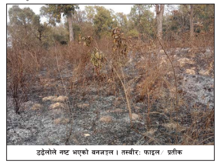
उढेलोले नष्ट भएको वनजङ्गल।

पश्चिम राजमार्ग वारिपारिका सबैजसो वनमा अहिले उढेलोको मुस्तो, उढेलोले जलेको ठुटा र खरानी देखिन्छ। उढेलोले