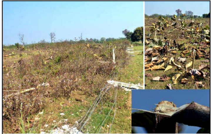
रामवनमा मङ्गलवार राति वृक्षारोपण गरिएका बिरुवा र लाश्रा काटिएको र तारबार भौँचिएको दृश्य ।