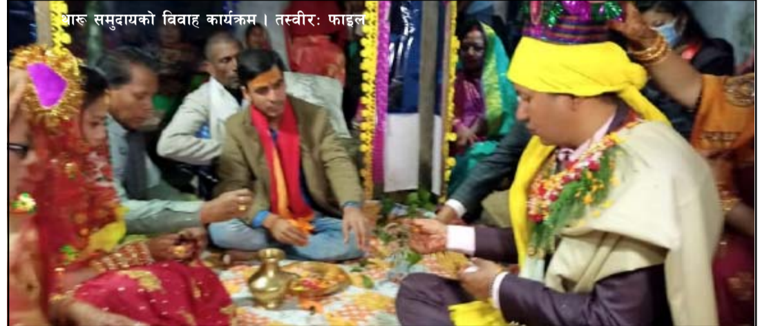
थरुहट समुदायको विवाह कार्यक्रम ।

समुदायबाट हरेक सामानको व्यवस्थापन गरी बिहे गराउने चलन रहेका बताए । बिहेमा आवश्यक चामल, दाल, तरकारी,