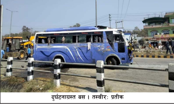
दुर्घटनाग्रस्त बस।

दुर्घटना भएको हो। बस दुर्घटना हुँदा ३६ जना यात्री घाइते भएको बारा प्रहरीले जनाएको छ। साइकलयात्रीलाई बचाउन