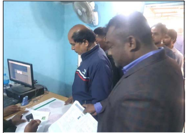
यातायात व्यवस्था कार्यालय, लाइसेन्स वीरगंजमा निशुल्क निरोगिता प्रमाणपत्रको आवेदन भर्ने सेवाग्राहीहरू ।

चासो नदेखाउनुको कारण बिचौलियातर्फबाट राजनीतिक दबाब र आर्थिक प्रलोभन थियो । चिकित्सकमाथि दुर्व्यवहार भएपछि यातायातले निरोगिता प्रमाणपत्र केही दिनको लागि रोकेको