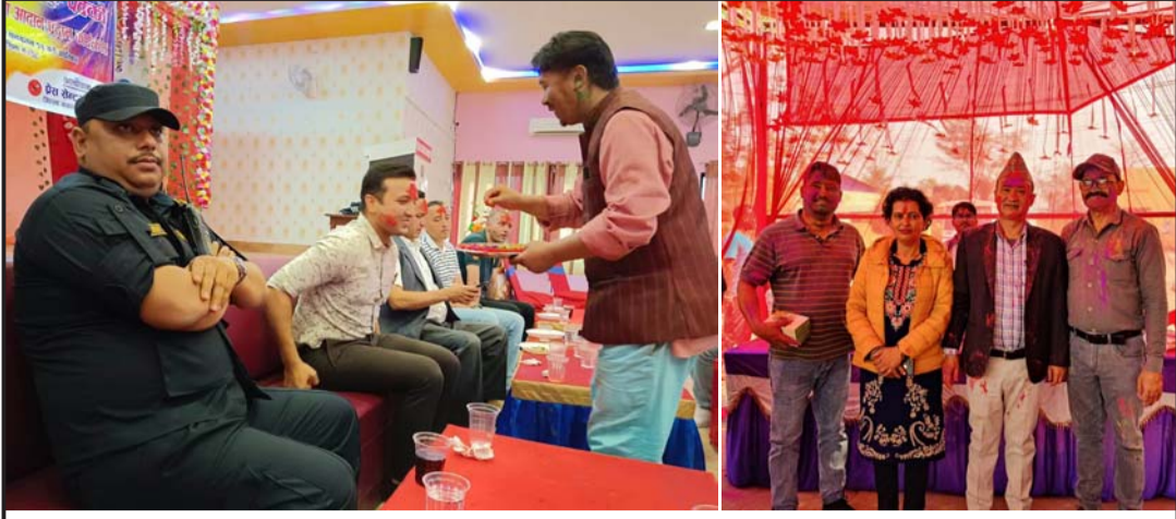
डाइपोर्ट सञ्चालन गर्ने प्रिस्टिन ठ्याली डाइपोर्ट प्रालि, श्रीसिया सुक्खा बन्दरगाह र माओवादीनिकट प्रेस सेन्टर पर्सको होली मिलन समारोहको दृश्य ।