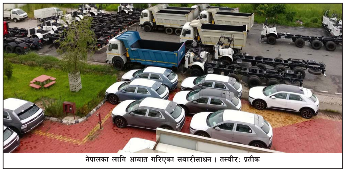
नेपालका लागि आयात गरिएका सवारीसाधन ।

उनका अनुसार कुनै कुनै दिन नेपाल आयल निगमको डिजल, पेट्रोललागायत पेट्रोलियम पदार्थ ठूलो परिमाणमा आयात हुँदा डेढदेखि दुई अर्बसम्म पनि राजस्व