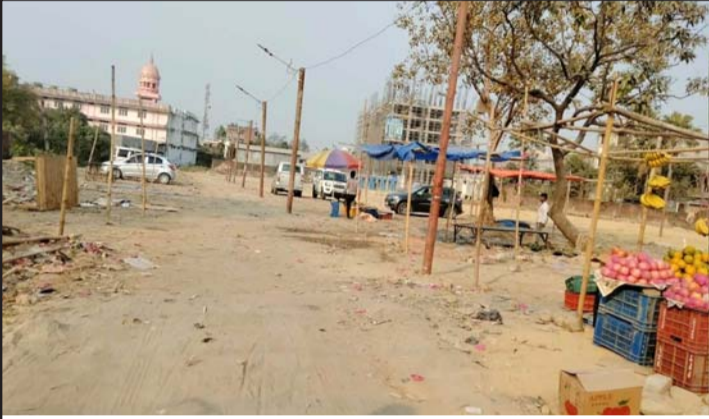
गीता मन्दिरअगाडि महानगरले बनाएको नयाँ बजार । तस्वीर: प्रतीक

यसैबीच, वीरगंज महानगरले गहवामाई मन्दिरअगाडिबाट हटाएको खुद्रा बजार पनि फागु पूर्णिमाको अवसरमा पुनः शुरू भएको छ । महानगरले गहवामाई मन्दिरअगाडिको सडकखण्डमा व्यापार व्यवसाय गर्न निषेध गरेको थियो । नगर प्रहरी तथा प्रहरी परिचालन गरेर सो ठाउँबाट साइकलबाहेक आवतजावतमा रोक लगाएको महानगरले पछिल्लो समयमा वैवाहिक कार्यक्रमको लागि मन्दिर दर्शन