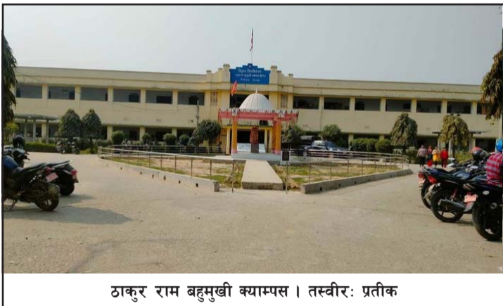
ठाकुर राम बहुमुखी क्याम्पस ।

विरोधका लागि फागुन २५ गतेसम्मको मिति दिइएको छ ।