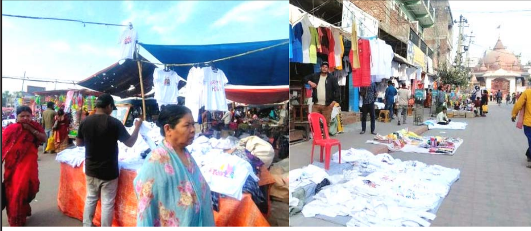
फागु पूर्णिमाको लागि विपी उद्यान क्षेत्र र गहवामाई मन्दिर क्षेत्रमा बेचन राखिएका फागु टिसर्ट ।