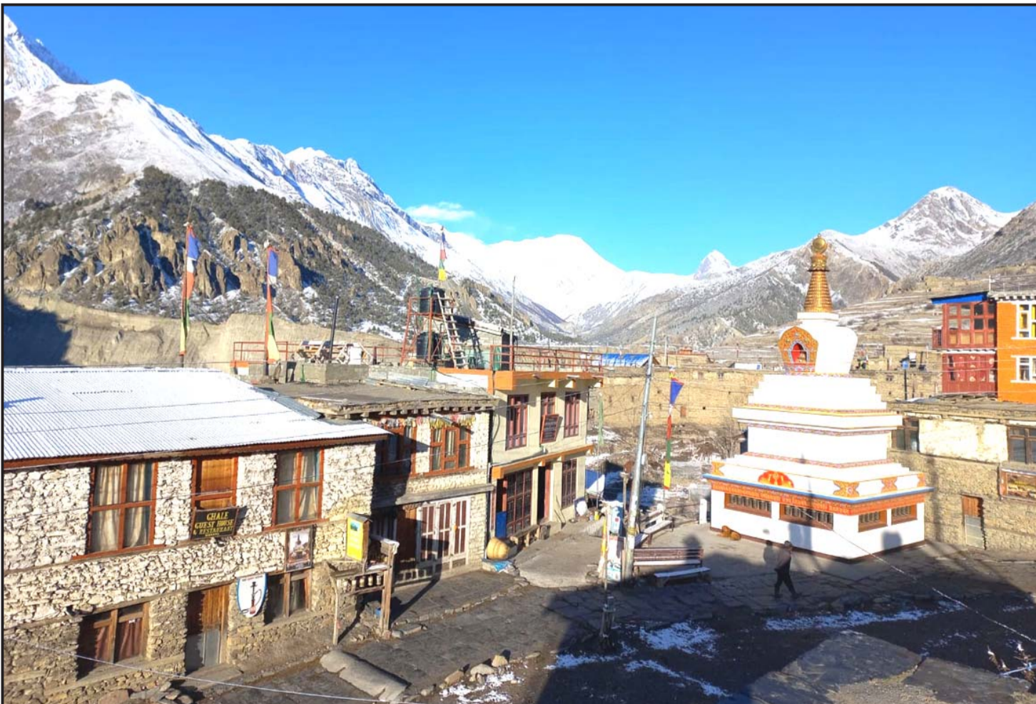
हिमपातपछि खुलेको मनाङ : मनाङ डिस्त्रिक्ट गाउँपालिका-६ माथिल्लो मनाङमा हल्का हिमपातपछि खुलेको मौसममा देखिएको तिलिचो पिक र सेताम्मे हिउँले भरिएको पाखा ।