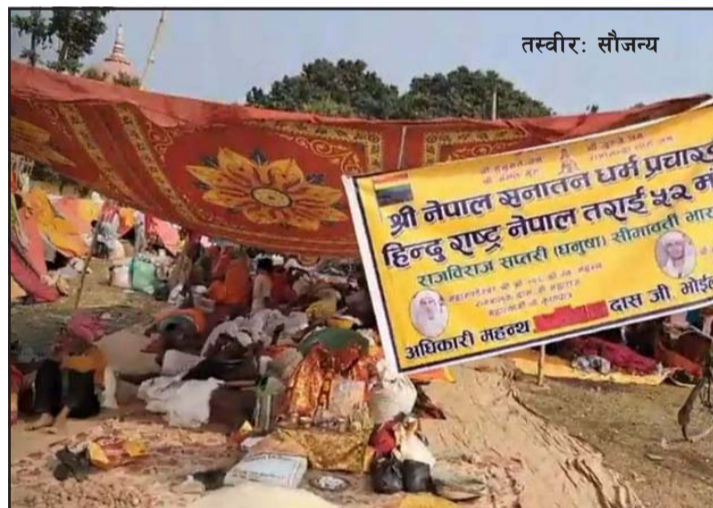
धुवकण्ड, कञ्चनवन, क्षीरेश्वरनाथ (पर्वता), धनुषाधाम, सतोषर पाँचकोसे अन्तर्गृह परिक्रमा गरी समाप्त हुनेछ।

जनकपुरधामबाट कल्याणेश्वर हुँदै फूलहर, मठिहानी, जलेश्वर, मडई,