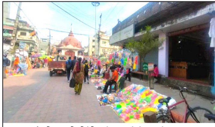
गहवामाई मन्दिरअगाडि निषेधित क्षेत्रमा लागेको फागुको खुद्रा बजार ।

फर्केका छन् भने केही व्यापारी मात्र अहिले गीता मन्दिरनजीकको नयाँ