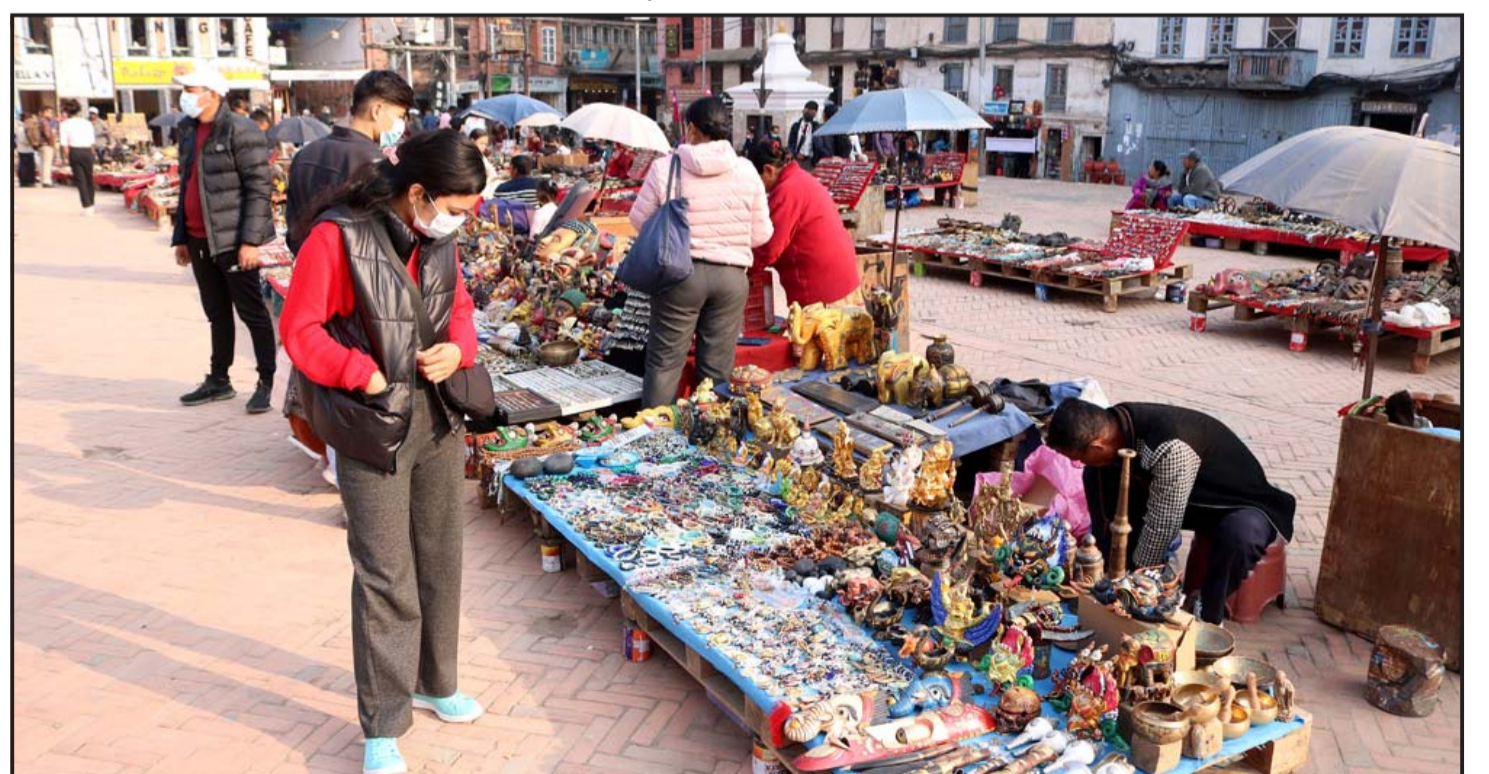
गहना हेर्दै : काठमाडौंको वसन्तपुरमा स्वदेशी ध्वं विदेशी पर्यटकका लागि बिक्रीमा राखिएको गरजगहना हेर्दै आन्तरिक पर्यटक।

अनुसन्धान कार्यालय पथलैया, बारामा बुझाएको जिप्रका, पर्साले जनाएको छ।