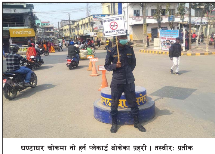
घण्टाघर चोकमा नो हर्न प्लेकार्ड बोकेका प्रहरी।

हर्न निषेधित क्षेत्र बनाउन पर्स प्रहरीले अँगालेको प्रक्रियापति नगरवासीहरूको चित्त बुझेको छैन। चर्को घाममा चोकचोकमा एकजना प्रहरी उभिएर 'नो हर्न' प्लेकार्ड देखाउने गर्दा आफूहरू अपमानित महसूस गर्ने गरेको एकजना प्रहरी अधिकृतले प्रतिक्रिया दिए।