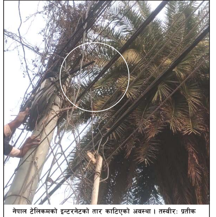
नेपाल टेलिकमको इन्टरनेटको तार काटिएको अवस्था।

वीरगंजलगायत आसपासका क्षेत्रमा धेरैबटा निजी क्षेत्रका इन्टरनेट सेवाप्रदायकको तार एट्टै पोलमा रहेकाले