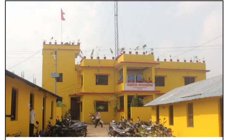
पोखरिया नगरपालिका