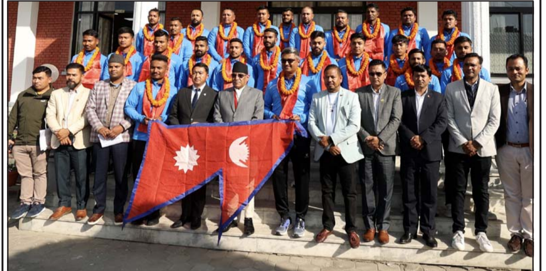
प्रम प्रचण्डसँग आइसिसी विश्वकप लिग-२ का विजेता खेलाडीहरू।

विजेता खेलाडीलाई प्रधानमन्त्री निवास बालुवाटार बोलाएर प्रधानमन्त्रीले बधाई दिनुका साथै पुरस्कारसमेत दिने