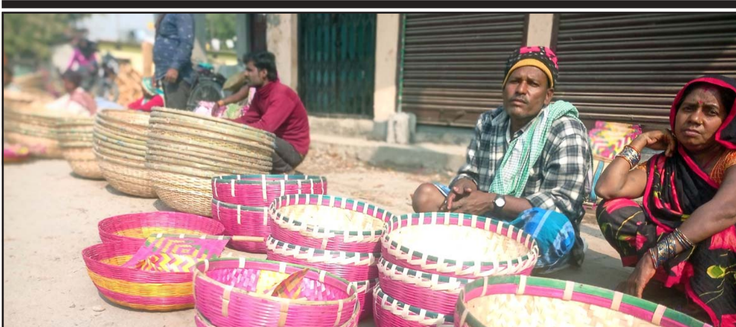
बिक्रीमा ढाकी: सुनसरीको इनरुवास्थित बिहीवारे हटियामा बिक्रीका लागि राखिएका ढाकी। बाँसबाट बनेका ढाकी प्रतिगोटा रु ३०० मा बिक्री हुने व्यापारी बताउँछन्।

हुनत यस्ता समस्या ऋणीमा पनि देखिएको छ। कतिपयले आफ्नो क्षमता नहेरी पाएजति रकम लिने र त्यसको उचित व्यवस्थापन गर्न नसक्दा आफ्नै बिलिबन्दा गरेको पनि देखिएको छ। वास्तवमा नेपाल राष्ट्र बैंकले प्रभावकारी अनुगमन नगर्दा यस्तो बेथिति मौलाएको हो। त्यसैले इजाजत दिएपछि तदनुकूल कार्य भए-नभएको अनुगमन गर्ने दायित्व पनि नेपाल राष्ट्र बैंकको हो। यो दायित्व बैंकले अनिवार्यरूपमा निर्वाह गर्नुपर्छ। समग्रमा आफ्ना सदस्य तथा ऋणीको हितलाई बेवास्ता गर्दै जसरी पनि धेरैभन्दा धेरै मुनाफा आर्जन गर्ने कार्यमा लघुवित्तहरू लागेकैले यस्तो समस्या निम्त्याएको हो। ऋणीको कर्जा भुक्तानी क्षमता, आम्दानीको स्रोत, कर्जा उपयोगितालगायत पक्षको बेवास्ता गरी जसरी पनि ऋण लगानी गर्ने सोचले यस्तो अवस्था आएको हो। बैंक तथा वित्तीय संस्थासम्बन्धी ऐन अनुसार