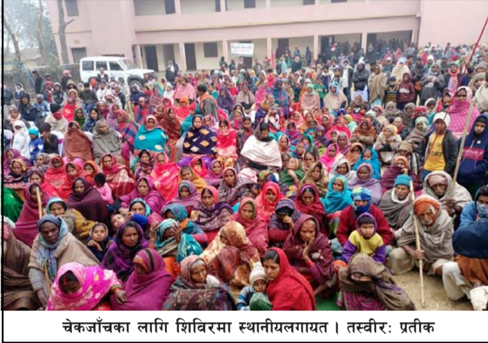
चेकजाँचका लागि शिविरमा स्थानीयलगायत।