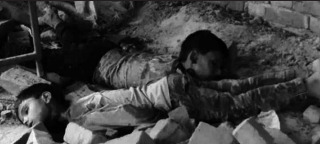
बारामा पाँच वर्षअघि हत्या गरिएका दुई बालक