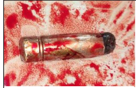
गत पुस ८ गते बाराको महागढीमाई नपा-२ स्थित भूतहीखोलानजीकै एक पुरुषलाई गोली हानी हत्या गरिएपछि शवबाट निकालिएको गोली