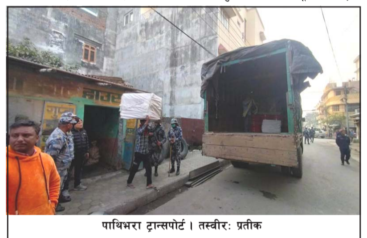
पाथिभरा ट्रान्सपोर्ट । तस्वीर: प्रतीक

र बिलबीजक लिएर कार्यालयमा अनुसन्धान गर्ने बताए । बिहान, बेलुकी, राति कुनै पनि बेला सूचना पाएको