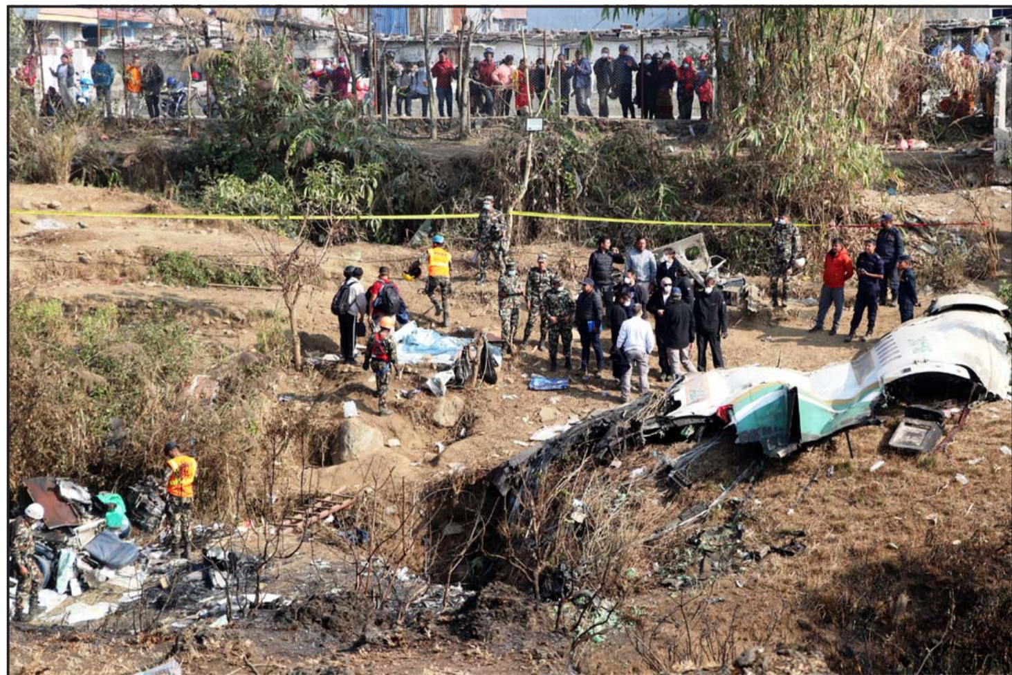
विमान दुर्घटनास्थलमा अध्ययन गर्दै विज्ञ टोली : पोखरामा यही माघ १ गते भएको यति एयरलाइन्सको विमान दुर्घटनाबारे बुधवार स्थलगत अध्ययन गर्दै फ्रान्सस्थित एटिआर कम्पनीको विज्ञ टोली ।

स्युडोप्युपिलस: वास्तवमा यस्ता जीवको आँखामा नानी हुँदैन । यिनीहरूको आँखा मिश्रित हुन्छ, भट्याङ्गसहरह । तर एउटा वा दुईवटा डाक स्पट हुन्छ, जसलाई स्युडोप्युपिलस भनिन्छ । - प्रतीक डेस्क (एजेन्सको सहयोगमा)