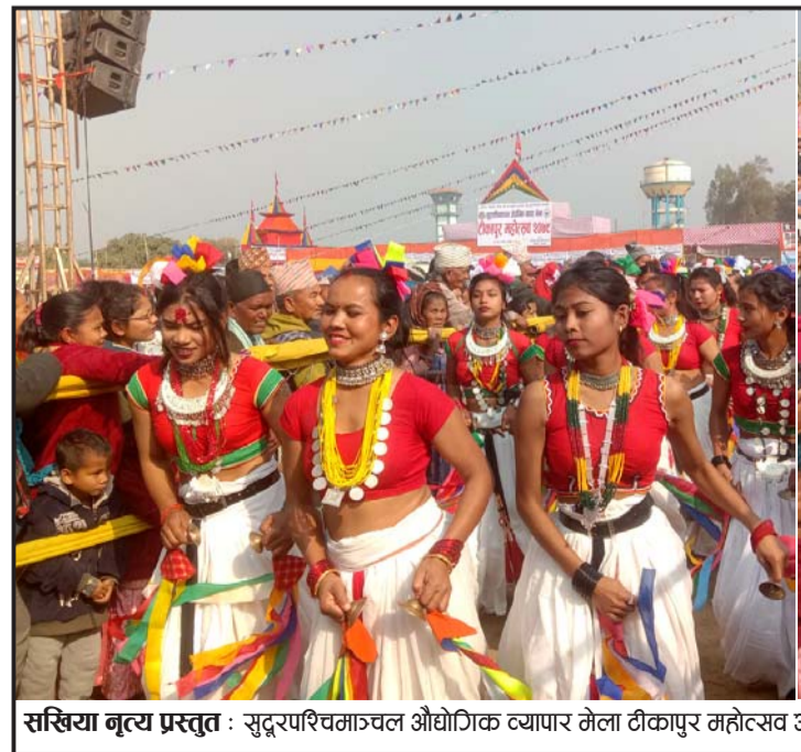
सखिया नृत्य प्रस्तुत: सुदूरपश्चिमाञ्चल औद्योगिक व्यापार मेला टीकापुर महोत्सव उद्घाटनका अवसरमा सखिया नृत्य प्रस्तुत गर्दै थारू समुदायका महिला।