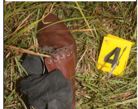
गत असोजमा प्रसौनी गापा-५ बारानजीकै पतिद्वारा पत्नी र छोराछोरीको हत्या।