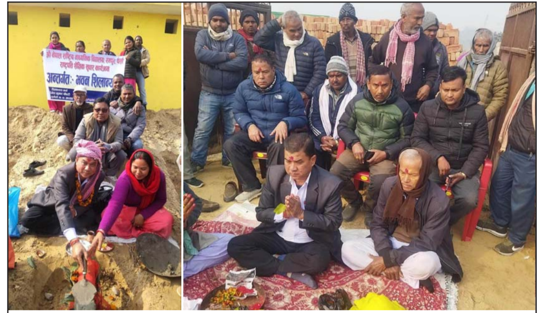
विद्यालय भवन र नेरेसो शाखा भवनको शिलान्यास कार्यक्रमको दृश्य।