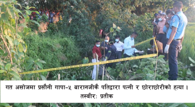
गत असोजमा प्रसौनी गापा-५ बारानजीकै पतिद्वारा पत्नी र छोराछोरीको हत्या।

वर्षयताको मानव हत्या घटनासम्बन्धी अपराधको तथ्याङ्क हेर्ने हो भने डरलाग्दो छ। २०७५/७६ मा २३ वटा हत्या घटनाका मुद्दा जिल्ला प्रहरी कार्यालयमा दर्ता थियो। जसमा २५ जनालाई पक्राउ गरी अनुसन्धान गरी कानूनी कारबाही अघि बढाइसकेको छ भने २१ जना फरार सूचीमा छन्।