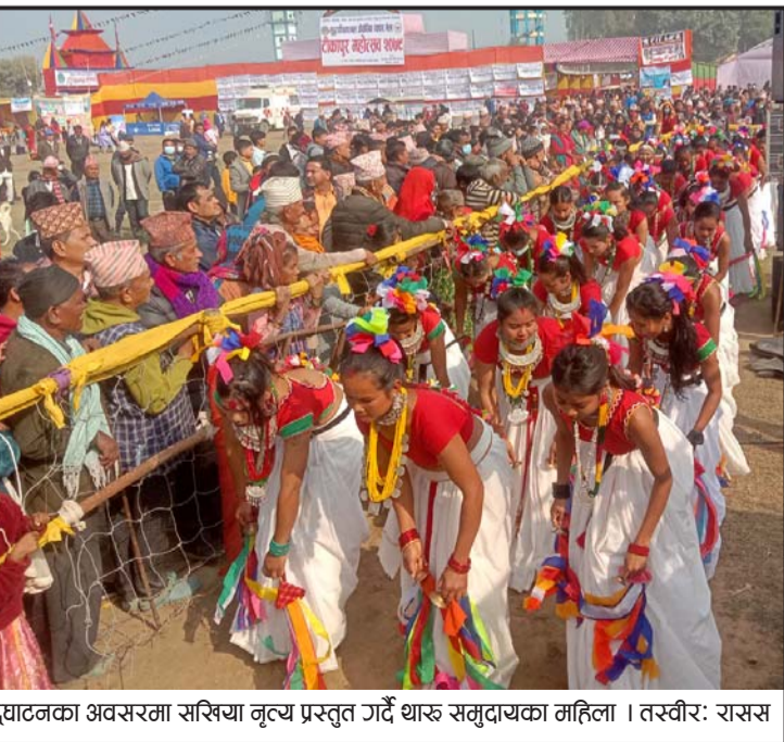
सखिया नृत्य प्रस्तुत: सुदूरपश्चिमाञ्चल औद्योगिक व्यापार मेला टीकापुर महोत्सव उद्घाटनका अवसरमा सखिया नृत्य प्रस्तुत गर्दै थारू समुदायका महिला।