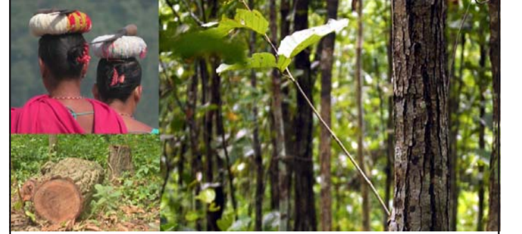
टाउको हिसिया बोकी जङ्गलतर्फ जाँदै स्थानीय, तस्करबाट काटिएको रूख र वनजङ्गल संरक्षण गरेसँगै पुनर्उत्पादन भइ हुकिएका सालका लाग्रहरू ।

रूखहरूको तुलनामा सालको रूख अत्यधिक छ । साल प्रजातिको रूखबाट पाउने काठको महत्त्व विशिष्ट छ । साल