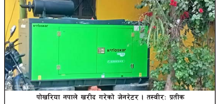
पोखरिया नपाले खरीद गरेको जेनेरेटर ।

कार्यालयले सूचना प्रकाशित नगरी विनाप्रतिस्पर्धा जेनेरेटर खरीद गरेको सार्वजनिक भएपछि बुधवारदेखि कार्यालयमा जनप्रतिनिधिहरूबीच आरोप-प्रत्यारोप शुरू भएको एकजना कर्मचारीले बताए । एकभरी जनप्रतिनिधि जेनेरेटर