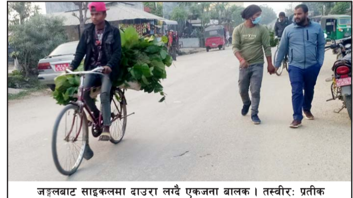
जङ्गलबाट साइकलमा दाउरा लगेर एकजना बालक ।

तस्करीहरू पनि वन फँडानीमा सक्रिय हुने गरेका छन् । घरायसी प्रयोजनका