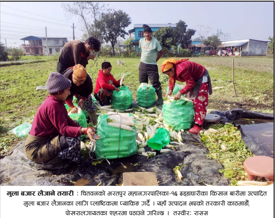
मुला बजार लैजाने तयारी : चितवनको भरतपुर महानगरपालिका-१६ ढड्ढाघाटीका किसान बारीमा उत्पादित मुला बजार लैजानका लागि प्लाष्टिकमा प्याकिड गर्दै । यहाँ उत्पादन भएको तरकारी काठमाडौं, पोखरातर्फ जायतका शहरमा पठाउने गरिन्छ ।