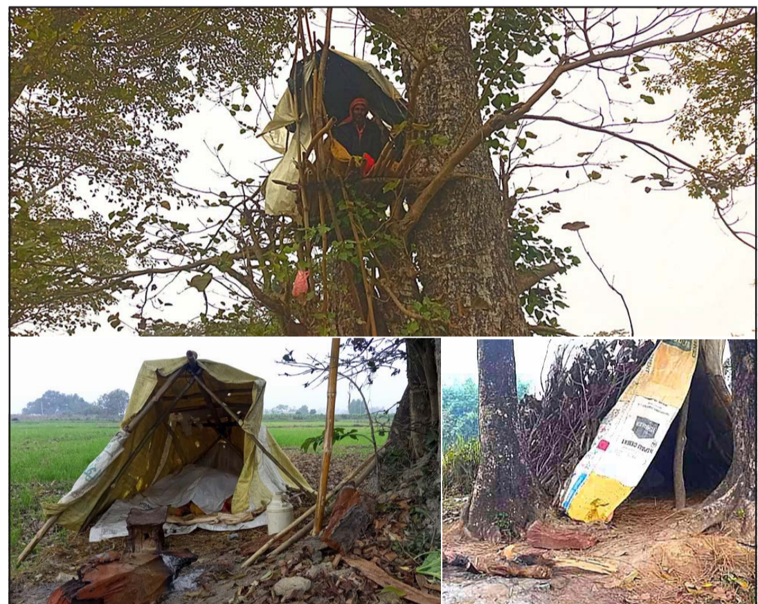
जङ्गली जनावरबाट बालीलाई जोगाउन किसानले बनाएको अस्थायी निवास स्थान ।

अहिले वनजङ्गल क्षेत्रका मानिसहरू घरायसी प्रयोजनका लागि दाउरा सङ्कलन गर्न, चौपाया पशुका लागि रुखको हाँगा लिनका लागि वनजङ्गल पस्ने गरेका छन् । चीसोमा वन गस्ती पनि कम हुने भएकोले तस्करीहरू अहिले बढी सक्रिय भएको स्थानीयले बताए ।