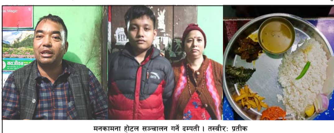
मनकामना होटल सञ्चालन गर्ने दम्पती ।

खाना खाएका ग्राहक अन्य होटलमा नजाने गरेको ग्राहकहरू बताउँछन् । रु २०० मा