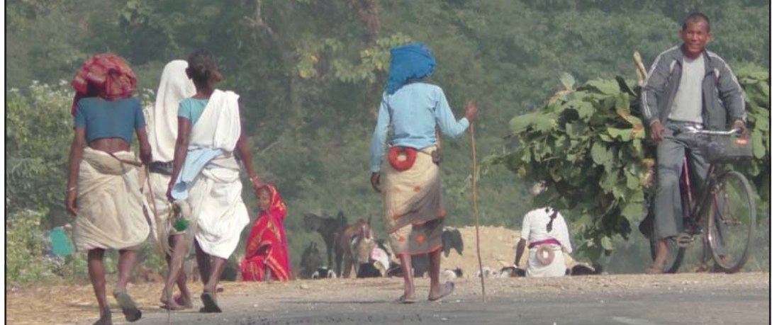
कोल्हवी क्षेत्रको जङ्गलमा हात्ती देखेपछि डराइडराइ वनजङ्गलतर्फ पशु चौपाया चरिचरण र दाउरा, घाँस गर्दै स्थानीयहरू।

गरेका छन्। त्यस वन क्षेत्रको जमुनीखोला, पाताल गङ्गामा सिमसार क्षेत्र भएकोले अटुट