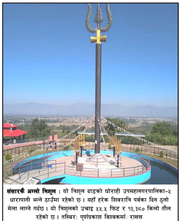
संसारकै अग्लो त्रिशूल : यो त्रिशूल वाडको घोरानी उपमहानगरपालिका-५ धारापानी भन्ने ठाउँमा रहेको छ । यहाँ हरेक शिवरात्रि पर्वका दिन ठूलो मेला लाग्ने गर्दछ । यो त्रिशूलको उचाइ ५५.५ फिट र १३,३८० किलो तौल रहेको छ ।