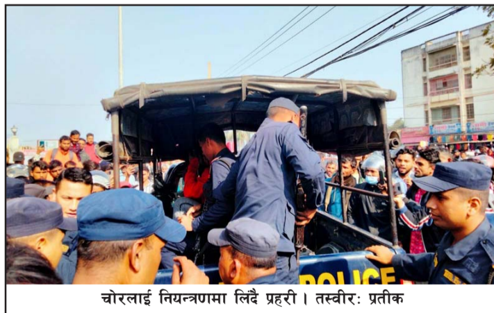
चोरलाई नियन्त्रणमा लिँदै प्रहरी।