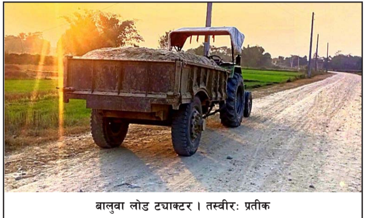
बालुवा लोड ट्याक्टर । तस्वीर: प्रतीक

नजीकका प्रहरी तथा सशस्त्र प्रहरी एकाइमा मासिक नजरानासमेत बुझाउने गरेको छ ।