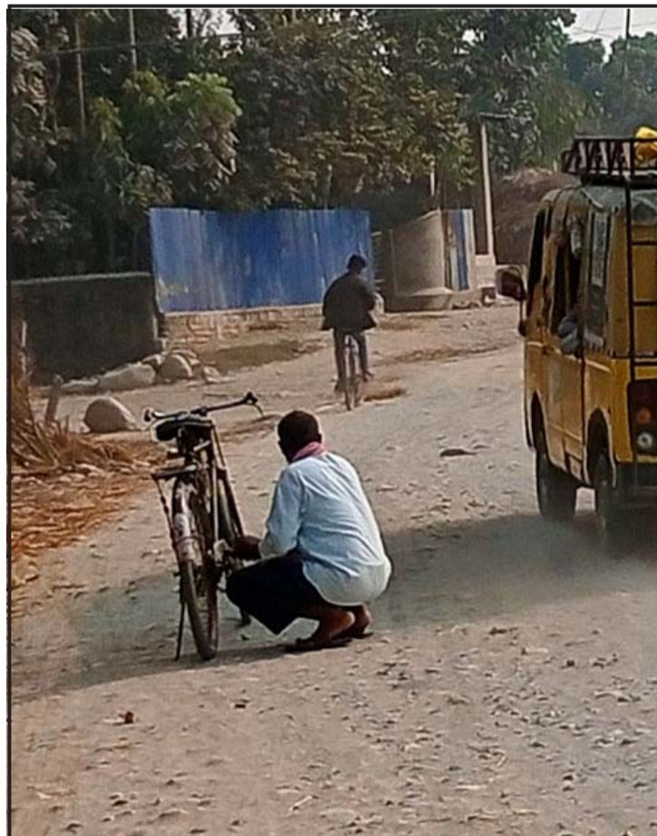
जोखिम मोलेर विद्यालय : सुनसरीको हरिनगर गाउँपालिकामा विद्यालयको सवारीसाधनमा भुङ्किइएर यात्रा गर्दै विद्यार्थी।