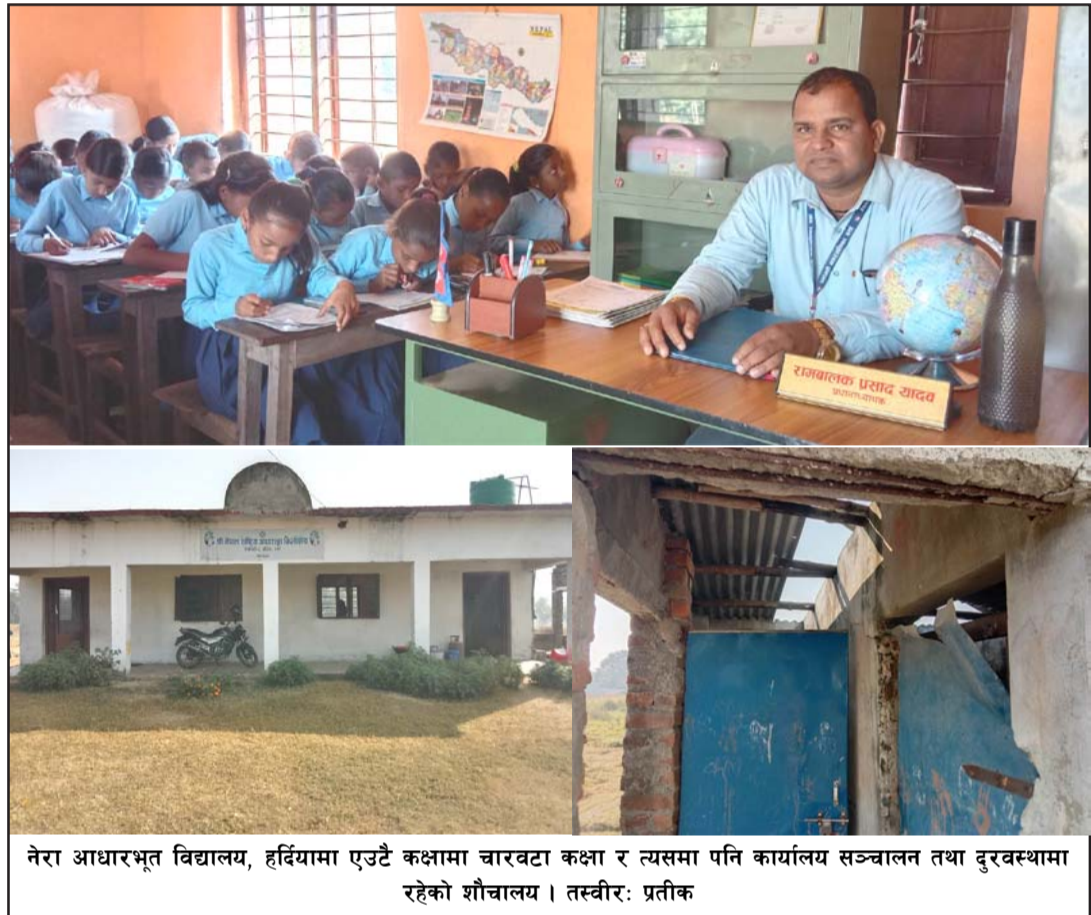
नेरा आधारभूत विद्यालय, हर्दियामा एउटै कक्षामा चारवटा कक्षा र त्यसमा पनि कार्यालय सञ्चालन तथा दुरवस्थामा रहेको शौचालय ।