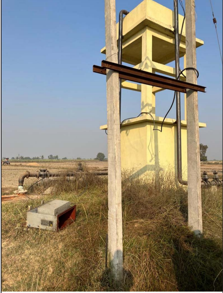
बारामाको प्रस्टोकामा चोरी भएको ट्रान्सफर्मरको बाहिरी खोल।