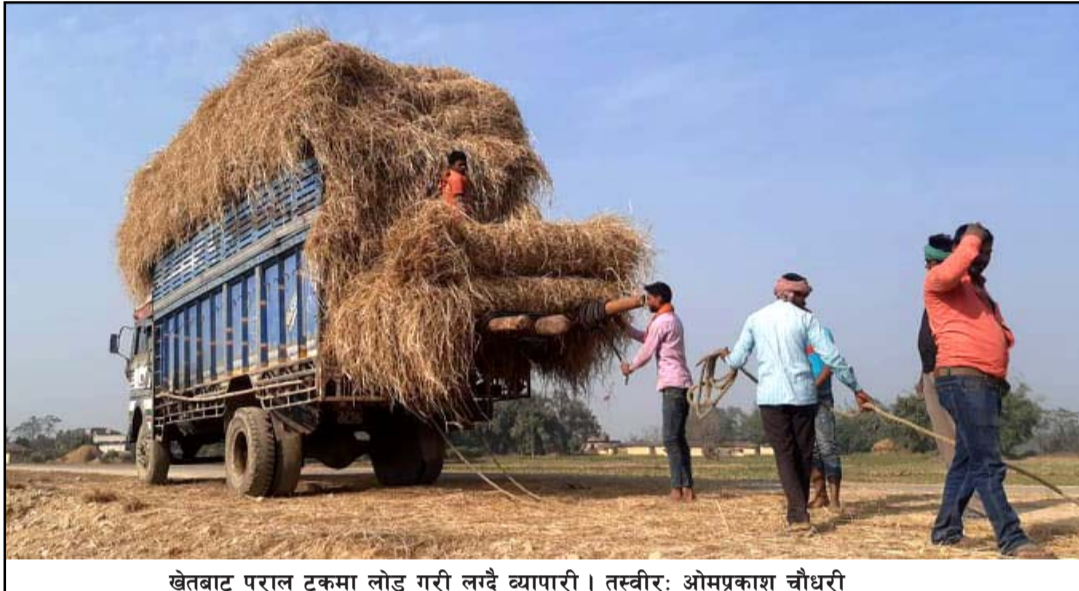
खेतबाट पराल टुकमा लोड गरी लामै व्यापारी।

छ। खेत, घर, खलियानमा पुगेर पराल खरीद गर्नेहरूले किसानसँग सस्तोमा खरीद गरेर व्यापारीलाई बढीमा बिक्री