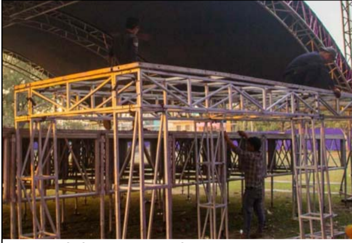
कन्सर्टको लागि विराटनगरमा तयार गरिएको मञ्च।

वीरगंजमा मङ्सिर १९ गते हुन गइरहेको नेपथ्य लाइभ कन्सर्टमा पाँच हजारभन्दा बढी दर्शक सामेल हुने पत्रकार सम्मेलनमा जानकारी गराइएको थियो।