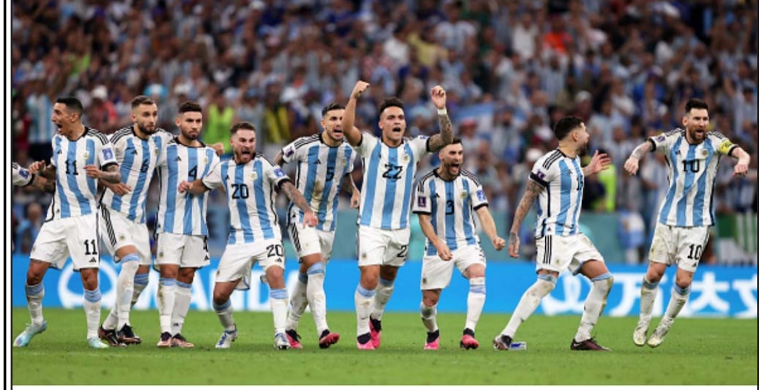
आइतवार सम्पन्न फिफा विश्वकप फुटबलको फाइनल खेलमा अर्जेन्टिनाले फ्रान्सलाई ३ गोलले पराजित गरेको छ। ३/३ गोलमा खेल बराबरी भएपछि पेनाल्टीमा अर्जेन्टिनाले फ्रान्सलाई ३ गोलले पराजित गरेको छ।