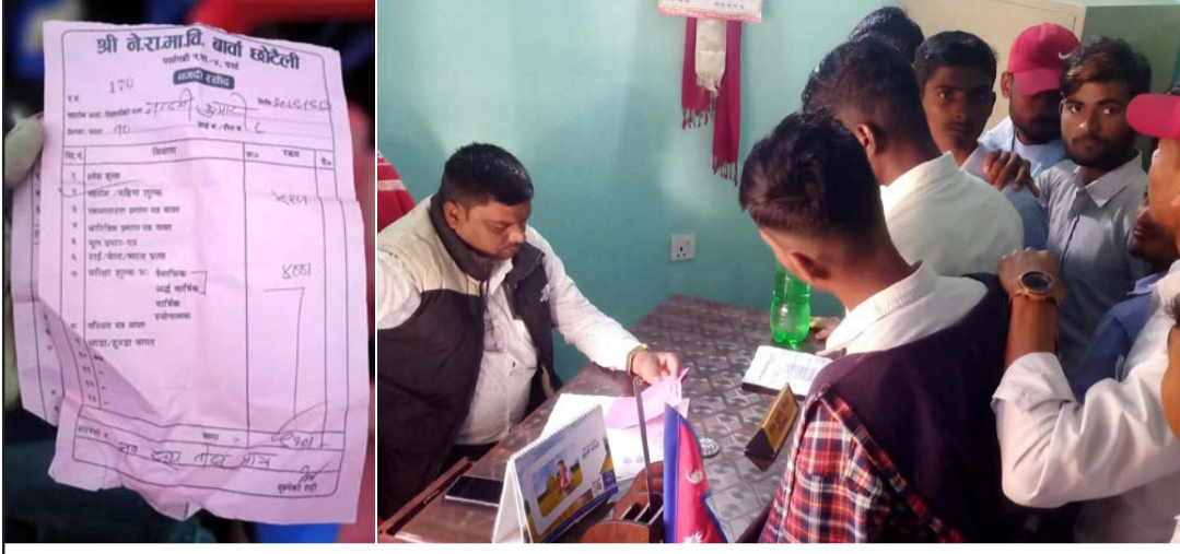
बढी शुल्क लिएको विरोध गर्दै विद्यार्थीहरू।