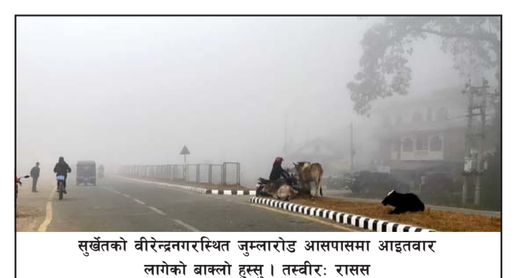
सुर्खेतको वीरेन्द्रनगरस्थित जुम्लारोड आसपासमा आइतवार लागेको बाक्लो हुस्सु ।

राति प्रदेश नं १, वागमती र गण्डकी प्रदेशका पहाडी भूभागमा आंशिकदेखि सामान्य बदली रही बाँकी भूभागमा आंशिक बदलीदेखि मौसम सामान्यतया सफा रहनेछ । प्रदेश नं १, वागमती र गण्डकी प्रदेशका उच्च पहाडी भूभागका