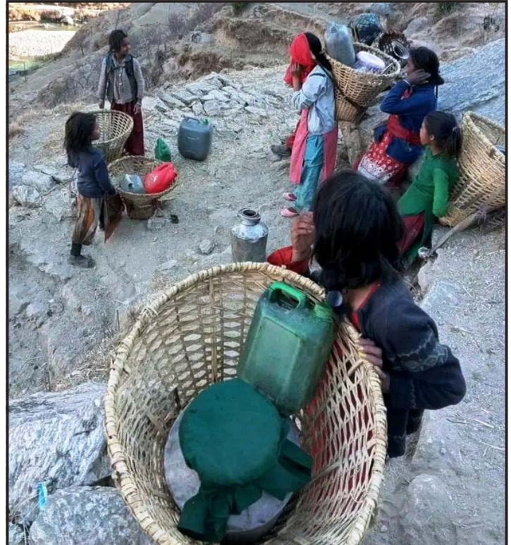
रारागाउँमा पानीको दुःख : जुम्लाको तिला गाउँपालिका-१, रारा गाउँको धारामा खानेपानी नियमित नआएपछि पिउनका लागि तिला नदीको पानी ल्याउने क्रममा बाटोमा थकाइ मारिँदै स्थानीय बालबालिका । रारा गाउँवासीलाई खानेपानीको चरम समस्या छ ।

डा बे हामदोज भन्छन्, “जलस्रोतको एक तिहाइ कृषिमा प्रयोग गरिन्छ, जबकि कतारको कुल गार्हस्थ्य उत्पादनमा कृषिको भूमिका एक प्रतिशतभन्दा कम छ । यो करीब ०.१ प्रतिशत मात्रै हो ।” अन्य देशहरू जस्तै कतारको खाद्यान्न उत्पादनमा प्राकृतिक स्रोतको ठूलो लगानी आर्थिक लाभको लागि होइन, तर कतारले आपतकालीन अवस्थामा आफ्ना जनतालाई खाद्यान्न उपलब्ध गराउने कुरा सुनिश्चित गर्न चाहन्छ । कतारसँग ऊर्जा स्रोतको विशाल भण्डार छ तर सौर्य ऊर्जामा उसले ठूलो लगानी गरिरहेको छ । यस क्षेत्रबाहिर बसोबास गर्ने मानिसहरूलाई कतारका ऊर्जा योजनाहरू अनौठा लाग्न सक्छन् । तर डा ले क्वीजेन भन्छन् कि कतारले सामना गर्ने चुनौतीहरू अन्य देशहरूभन्दा धेरै फरक छैनन् । “सुकखा देशहरूमा तपाईंलाई पानी चाहिन्छ, चीसो देशहरूमा तपाईंले आफू आफैलाई न्यानो राख्न आवश्यक छ । त्यसैले हामी सबैले सामना गर्नुपर्ने आआफ्नै चुनौतीहरू छन् ।” डा बेन हमादोज भन्छन्, “म आशावादी छु कि कतार र यो क्षेत्र ऊर्जाको धेरै अधिक माग गर्ने यी गहन प्रक्रियाहरूबाट पार पाउन सक्षम हुनेछन् । किनभने पानीविना बाँच्न सकिँदैन ।” कतारले सन् २०३६ मा ओलम्पिक खेलकूद आयोजना गर्न चाहेको हुल्ला चलेको छ, त्यस अवस्थामा कतारसामु थप चुनौतीहरू हुनेछन् । - प्रतीक डेस्क (एजेन्सीको सहयोगमा)