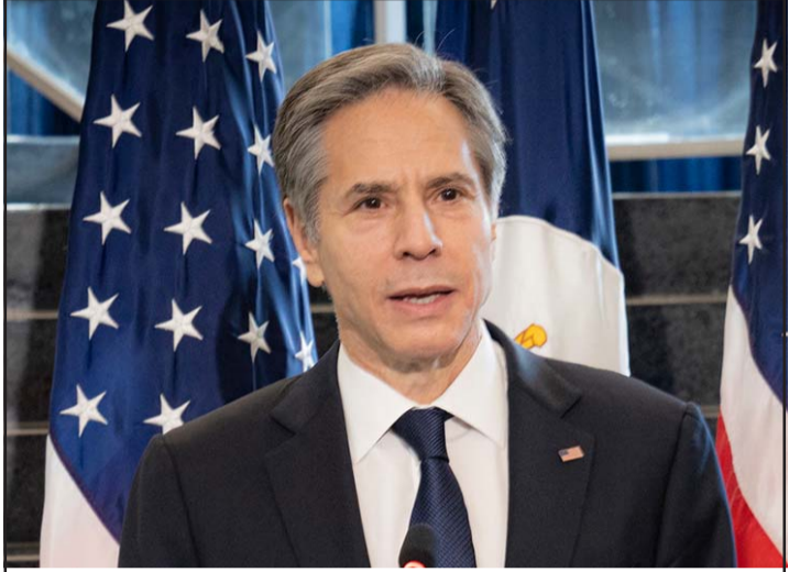
अमेरिकी विदेशमन्त्री एन्टोनी जे ब्लिन्केन।

भने, "यद्यपि अमेरिकाले सन् २०२२ मा सञ्चनाको वातावरणमा चीनले खडा गरेको सुरक्षा चुनौतीका लागि तयार