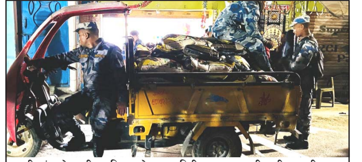
वीरगंजको रानीघाटस्थित गोदाममा बिहीवार छापामारी गरी भारतीय ब्राण्डको चामल नियन्त्रणमा लिई सशस्त्र प्रहरी।

जिल्ला प्रहरी कार्यालय, पर्साले शुक्रवार प्रेस विज्ञप्ति जारी गर्दै राजस्व छलेर भारतीय विभिन्न ब्राण्डका चामल, पीठो, मैदालगायत खाद्यान्न सामग्रीहरू नियन्त्रणमा लिई कारबाईको लागि वीरगंज भन्सार कार्यालय बुझाएको जनाएको छ। सीमामा जनपद तथा सशस्त्र प्रहरी हुँदाहुँदै पनि ठूलो परिमाणमा खाद्यान्न सामग्री भित्रिनुले