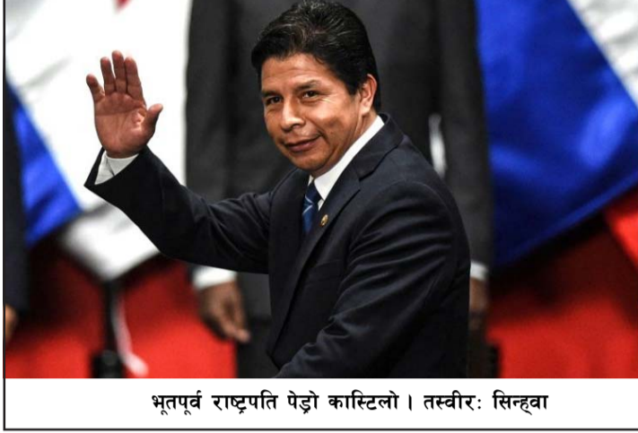
भूतपूर्व राष्ट्रपति पेड्रो कास्टिलो।