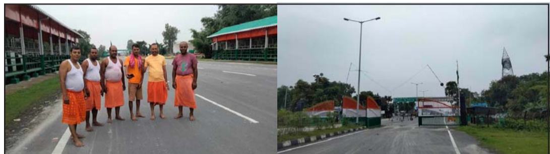
बङ्गलादेशको सीमामा लेखकलगायत।

भेषले पनि अलिकति आकर्षित गरेको हुनुपर्छ। हामी पनि अशिक्षित होइनौं। हाम्रो यस पहिचानलाई पनि चिनेको हुनुपर्छ। हामीलाई दुल्न र फोटो खिच्न कुनै किसिमको मनाही हुँदैन। हामी मञ्जाले फोटो खिचिरहेका छौं। आफैमा कुराकानी गरिरहेका छौं। अन्य कोही सुन्ने छैनन्। कोही रोक्ने छैनन्। तर यस्तो पनि अनुभूति हुन्छ कि क्यामराभै कैयौं आँखाहरूले हामीलाई हेरिरहेका छन्।