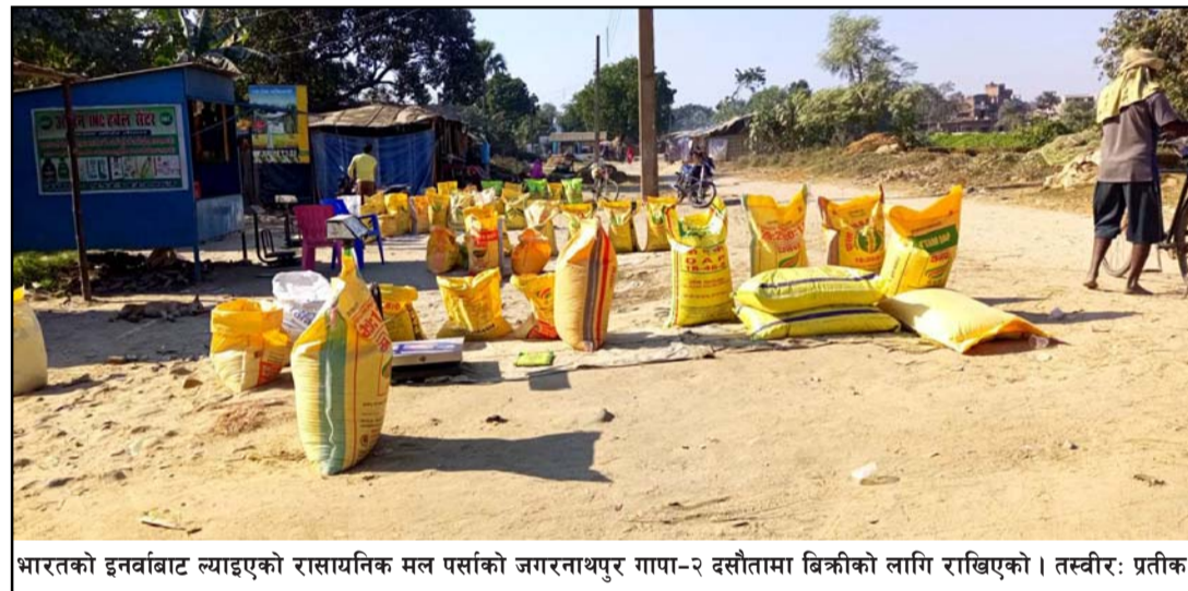
भारतको इनवाबाट ल्याइएको रासायनिक मल पर्साको जगरनाथपुर गापा-२ दसौतामा बिक्रीको लागि राखिएको।

वितरण गर्दा किसानहरूलाई सहज भएको छ। तर कतिपय किसानहरूले यी जातका बीउबाट राम्रो उत्पादन नभएको भन्दै भारतीय बजारबाट हाइब्रिड जातका गहुँका बीउ खरीद गरी ल्याएका छन्। यी जातका गहुँको बीउबाट प्रतिकट्टा डेढदेखि दुई मनसम्म उत्पादन हुने किसानहरूले बताए। हाइब्रिड जातको बीउबाट प्रतिकट्टा अढाई मनदेखि पाँच मन गहुँ उत्पादन हुने गर्छ। भारतीय बजार भङ्गाहा, इनवा,