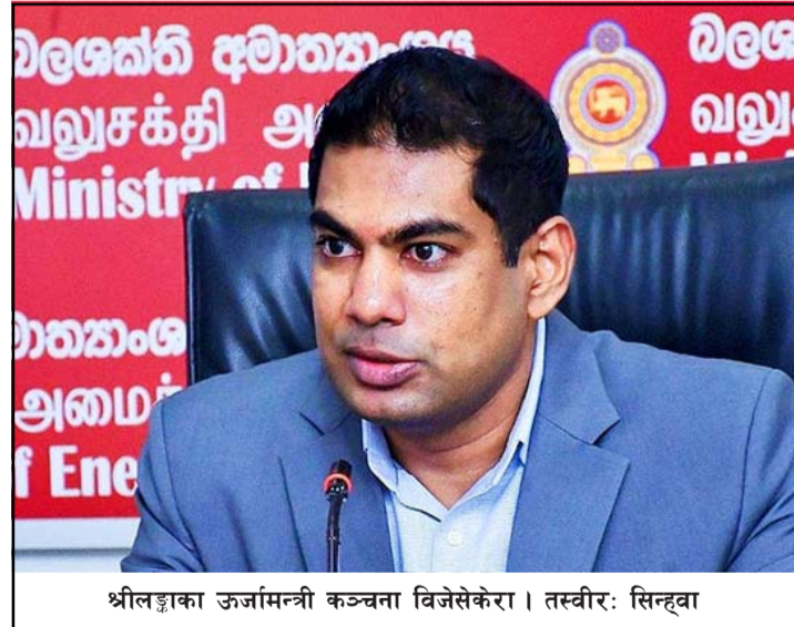
श्रीलङ्काका ऊर्जामन्त्री कञ्चना विजसेकेरा।

हुने भन्दै उनले विद्युत् महसूल परिमार्जन नगरी त्यसो गर्न नसकिने बताएका छन्।