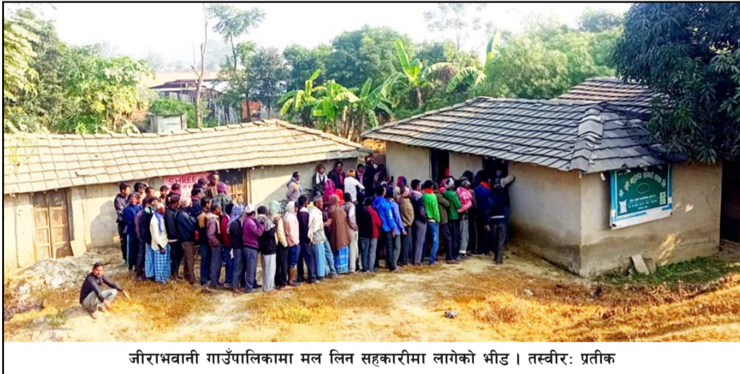
जीराभवानी गाउँपालिकामा मल लिन सहकारीमा लागेको भीड।

प्रस, सेठवा, १० मङ्सिर/ धानबालीपछि अर्को मुख्य बाली गहुँ छन अहिले किसानहरूलाई भ्याइनभ्याड भएको छ। किसानहरू यतिखेर गहुँ रोपका लागि आवश्यक उन्नत जातको बीउ, रासायनिक मल, खेतको सरसफाइ तथा जोताइमा लागेका छन। किसानहरूले खेतमा भएका पराल तथा टुटा जलाउनुका साथै जोताइ गर्न, पानीको मात्रा कम भएको जगामा सिंचाइ गर्न व्यस्त छन्। यसका साथै जीराभवानी र पटेवांसुगौली गाउँपालिकाले किसानहरूका लागि ५० प्रतिशत अनुदानमा विजय, एनएल र गौतम प्रजातिका उन्नत बीउ