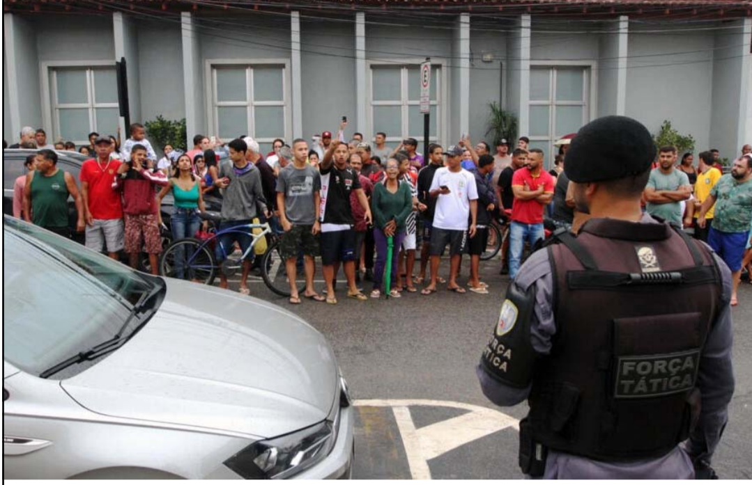
घटनापछि विद्यालयअगाडि एकत्रित भएका स्थानीय र अभिभावक।

मैले अप्रणीय क्षतिको लागि शोकको रूपमा तीन दिनको आधिकारिक