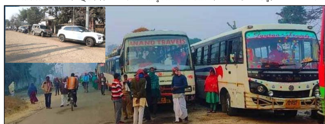
विवाह पञ्चमीको मेला भर्न जनकपुर जान भारतबाट भित्रिएका पर्यटकहरू वीरगंज भन्सारमा ।

गरेर भारतीय पर्यटकहरू नेपाल आउने क्रम बढेको छ । दुई दिनमा मात्र वीरगंज