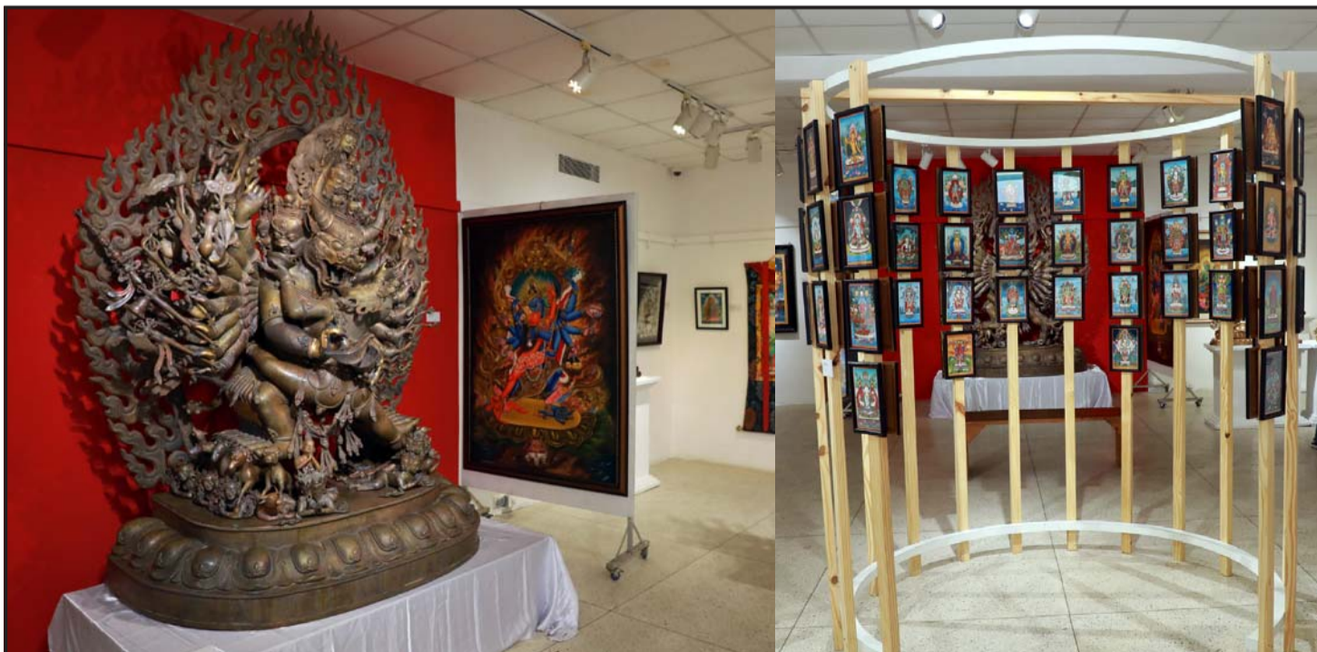
प्रदर्शनी राखिएका चित्रकला तथा मूर्तिकला: नेपाल कला परिषद्को आयोजनामा बबरमहलस्थित परिषद् भवनमा आइतवारदेखि शुरु 'नेपालका देउताहरू' नामक चित्रकला प्रदर्शनीमा राखिएका चित्रकला तथा मूर्तिकला।