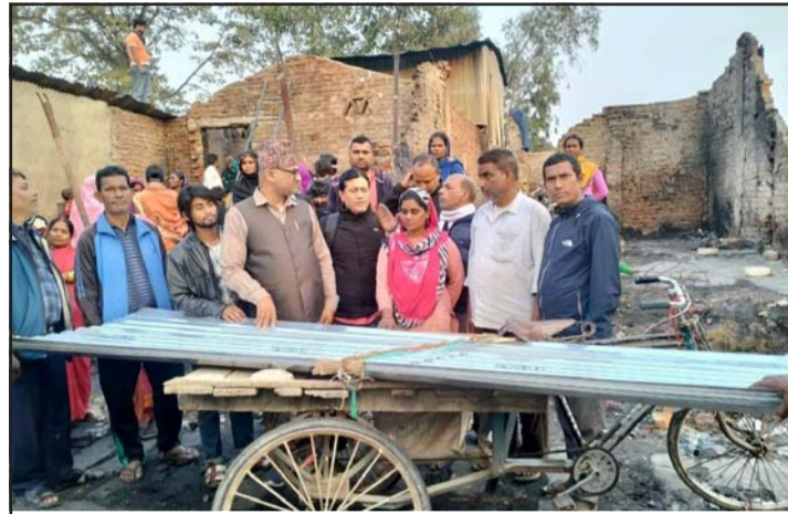
आगलागी पीडितलाई सहयोग गरिएको जस्तापाता।

सुदूरपश्चिम प्रदेशमा एमालेले नौ हजार ५३३, काङ्ग्रेसले सात हजार ८६, माओवादी केन्द्रले पाँच हजार २७३, राप्रपाले एक हजार ४७१ र नागरिक उन्मुक्ति पार्टीले दुई हजार ३३५ मत प्राप्त गरेका छन्।