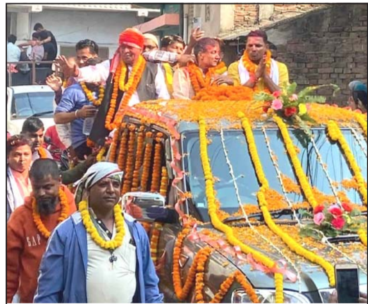
बिहीवार वीरगंजमा निकालिएको नेकाको संयुक्त जुलुस ।