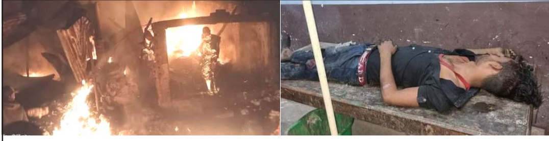
आगलागी नियन्त्रण गर्दै सुरक्षाकर्मी र आगलागीमा घाइते भएका व्यक्ति।