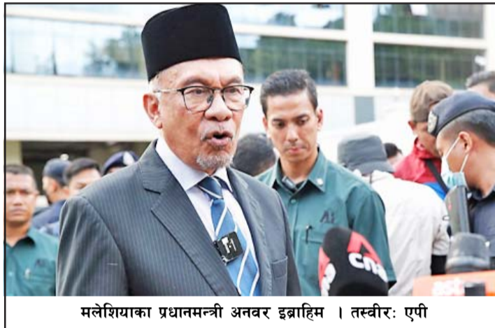
मलेशियाका प्रधानमन्त्री अनवर इब्राहिम।

त्यस्तै पूर्वप्रधानमन्त्री मुहिद्दीन यासिनको पेरिकाटन नेशनल (राष्ट्रिय