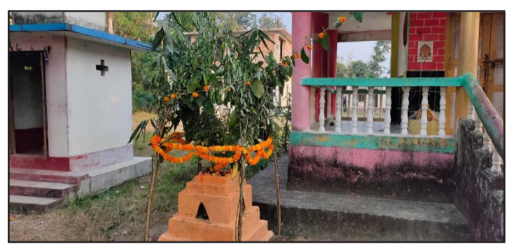
आज दिनभरि भगवान् विष्णुको पूजा गर्न ब्रतालुहरू मन्दिरमा पुगेका थिए ।

नारायणी अस्पताल, वीरगंजमा ल्याइएको थियो । थप उपचारको लागि उनलाई एलएस न्युरो अस्पतालमा भर्ना गरिएको थियो । उपचारको क्रममा शुक्रवार साँझ ५ बजे नाबालिकाको मृत्यु भएको प्रहरीले जनाएको छ । शवलाई शल्यपरीक्षणको लागि नारायणी अस्पतालमा पठाइएको छ भने घटनाको अनुसन्धान भइरहेको जिल्ला प्रहरी कार्यालय, पर्साले जनाएको छ ।