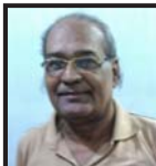
महामारताबाट सङ्कलन तथा अनुवाद अमाशङ्कर द्विवेदी

लम्बाइ र चौडाइ चार सय हातको थियो। सबै प्रकारका आयुधहरू त्यसमाथि