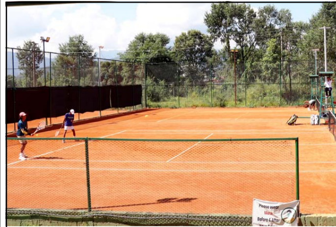
पोखरा रङ्गशालाको टेनिस कोर्टमा पुरुष डबलस्तर्फको विधामा प्रतिस्पर्धा गर्दै खेलाडी।

नवौं राष्ट्रिय खेलकूद प्रतियोगिता अन्तर्गत टेनिसको 'टिम इभेन्ट'तर्फको प्रतिस्पर्धामा विभागीय नेपाली सेनाका दुवै टोली फाइनलमा प्रवेश गरेका छन्। यसैगरी आयोजक गण्डकी प्रदेश पनि फाइनलमा प्रवेश गरेको छ।