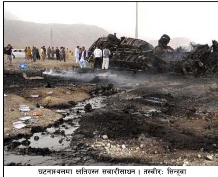
घटनास्थलमा क्षतिग्रस्त सवारीसाधन।

बम सडक छेउमा राखिएको र रिमोट कन्ट्रोल यन्त्रबाट विस्फोट गराइएको अधिकारीले बताएका छन्। अहिलेसम्म कुनै समूह वा व्यक्तिले आक्रमणको जिम्मा लिएको छैन। रासस