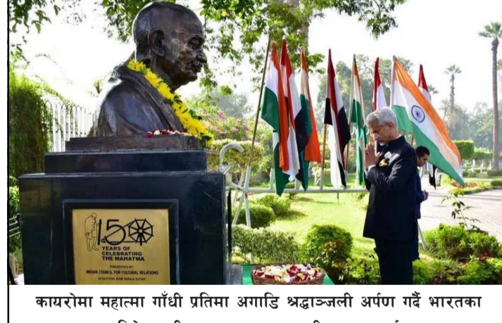
कायरोमा महात्मा गाँधी प्रतिमा अगाडि श्रद्धाञ्जली अर्पण गर्दै भारतका विदेशमन्त्री एस जयशङ्कर।

इजिप्टका विदेशमन्त्री सामेह हसन शौक्रीको निमन्त्रणामा भारतका विदेश मन्त्री जयशङ्कर इजिप्ट भ्रमणमा गएका हुन्। रासस