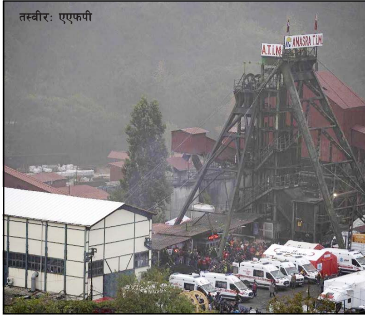
स्वास्थ्यमन्त्री फहरटिन कोकाले यस अघि सकुशल बाहिर निकालिएका ११ जनाको अस्पतालमा उपचार भइरहेको ट्वीट गरेका थिए। केही कामदार विस्फोटपछि आफैं बाहिर निस्कन सफल

ऊर्जामन्त्री फातिह डोनेमेजका अनुसार विस्फोटपछि एउटा सुरडमा आगो लागेको थियो। विस्फोटबाट प्रभावित सुरडहरू जमीनबाट करीब ३०० र ३५० मिटर तल रहेको अनुमान गरिएको छ।