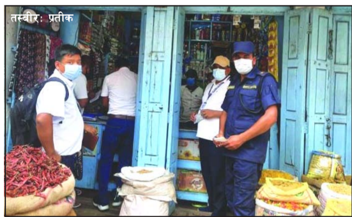
संरक्षण कार्यालय, पर्साले भदौ र असोजमा १६ वटा फर्मलाई कारबाई गरेर वाणिज्य कार्यालय, पर्साले जनाए अनुसार विभिन्न सरोकारवाला कार्यालय

र संस्थाहरूको सहभागितामा गरिएको अनुगमनमा मृत्युसूची नराखेका, खरीद बिल नदेखाएका र अनुगमनमा असहयोग गरेकासमेत गरी १६ वटा फर्मलाई कारबाई गरिएको जनाएको छ। आकर्षण ब्यूटीपार्लर, मिलन जनरल स्टोर्स, खड्का कोल्ड ड्रिक्स, टिबडेवाला इम्पेक्स, नीलाम्बरी, पशुपति भण्डार, फन एन्ड फन, दाजुभाइ चुरा पसल, फेशन आइकन स्टोर्स, पिआर ट्रेडर्स, लक्ष्मी कस्मेटिक, न्यू समी ट्रेडर्स, अन्नपूर्ण साडी सेन्टर, लक्ष्मीनारायण वस्त्रालय, राजधराना ट्रेडर्स र आरके किरानालाई कारबाई गरिएको र तिनीहरूबाट तीन लाख १५ हजार राजस्व सङ्कलन भएको जनाएको छ। यी सबै फर्म वीरगंज महानगरपालिका अन्तर्गतका हुन्।