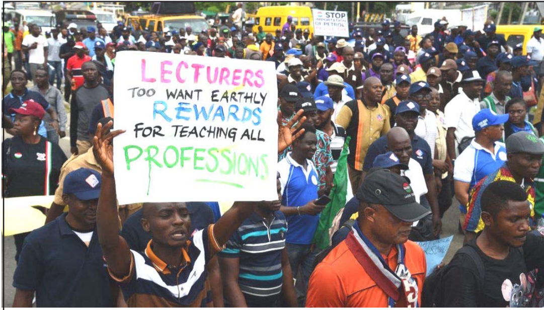
पछिल्लो दिनमा नाइजेरियाका विश्वविद्यालयका प्राध्यापकहरूको आन्दोलनको दृश्य।

लागोस, २८ असोज/एएफपी नाइजेरियाका विश्वविद्यालयका प्राध्यापकहरूले शुक्रवार तलब र अन्य सुविधाहरूलाई लिएर आठ महीनाको हडताल अन्त्य गरेका छन्। युनिभर्सिटीको एकेडेमिक स्टाफ युनियन (एएसयुयू)ले गरेको हडतालले सरकारसँग युद्धविरामका लागि वार्ता