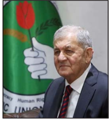
यस अघि सन् २००३ देखि २०१० सम्म जलस्रोत मन्त्री थिए।

नवनिर्वाचित राष्ट्रपति रशिदले वर्तमान राष्ट्रपति बर्हाम सालेहलाई विस्थापित गर्नेछन्। रशिदले उनैलाई पराजित गरेका हुन्। मतदानमा सहभागी सांसदहरूमध्ये १६० जनाले नवनिर्वाचित राष्ट्रपति रशिदलाई समर्थन गरेका थिए भने ९९ जनाले सालेहलाई मतदान गरेका थिए। नयाँ राष्ट्रपति चयन गर्न इराकको संसद् यस अघि दुईपटक असफल भएको थियो। अहिले ७८ वर्ष उमेर पुगेका रशिद