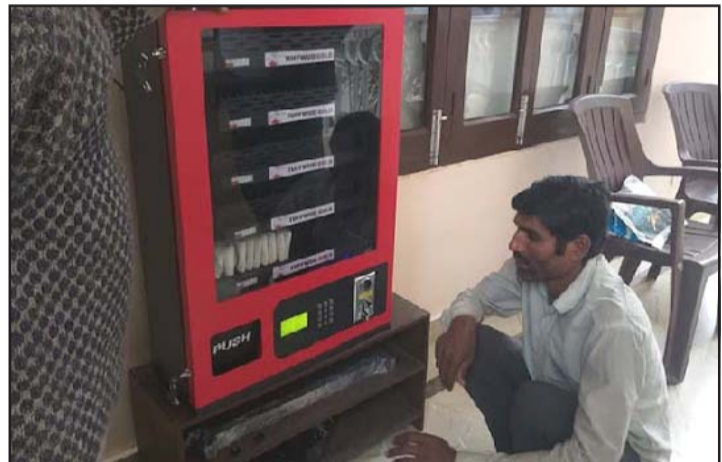
वीरगंजको एउटा सामुदायिक विद्यालयमा जडान गरिएको सेनिटरी प्याड एटिएम।

अन्य पालिकाहरूले भने साउनदेखि सेनिटरी प्याडको अभाव भन्दै आएको र यसतर्फ पालिकाहरूले ध्यान नदिएको एकजना सामुदायिक विद्यालयकी शिक्षिकाले बताइन्। उनले प्याड अभावमा कतिपय छात्राहरू महानगरीको बेला विद्यालय आउन छाडेको भन्दै यो समस्या तत्काल समाधान गर्न आग्रह गरे। सरकारले दिने रकम पनि पालिकाले समयमा वितरण गर्न नसक्नु दुर्भाग्यपूर्ण भएको उनको दुःखेसो छ।