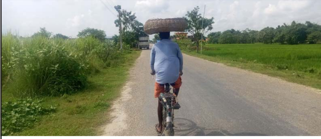
पोखरिया नगरपालिकामा माछा बिक्री गर्नको लागि टाउकोमा माछाको टोकरी राखी साइकलमा यात्रा गर्दै एकजना माछा विक्रेता ।