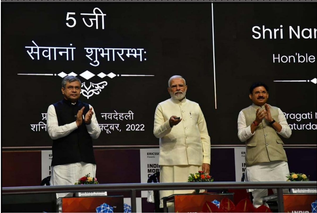
भारतमा शनिवार '५ जी' मोबाइल सेवाको शुभारम्भ भएको छ। भारतीय प्रधानमन्त्री नरेन्द्र मोदीले यो सेवाको शुभारम्भ गर्दै आगामी दिनमा सूचना तथा प्रौद्योगिकी क्षेत्रमा भारतको लागि ५ जी सेवा फलदायी हुने बताए। कार्यक्रममा प्रधानमन्त्रीको साथमा इलेक्ट्रानिक्स एवं सूचना प्रौद्योगिकी मन्त्री अश्विनी वैष्णव (बायाँ) लगायतको सहभागिता रहेको थियो।