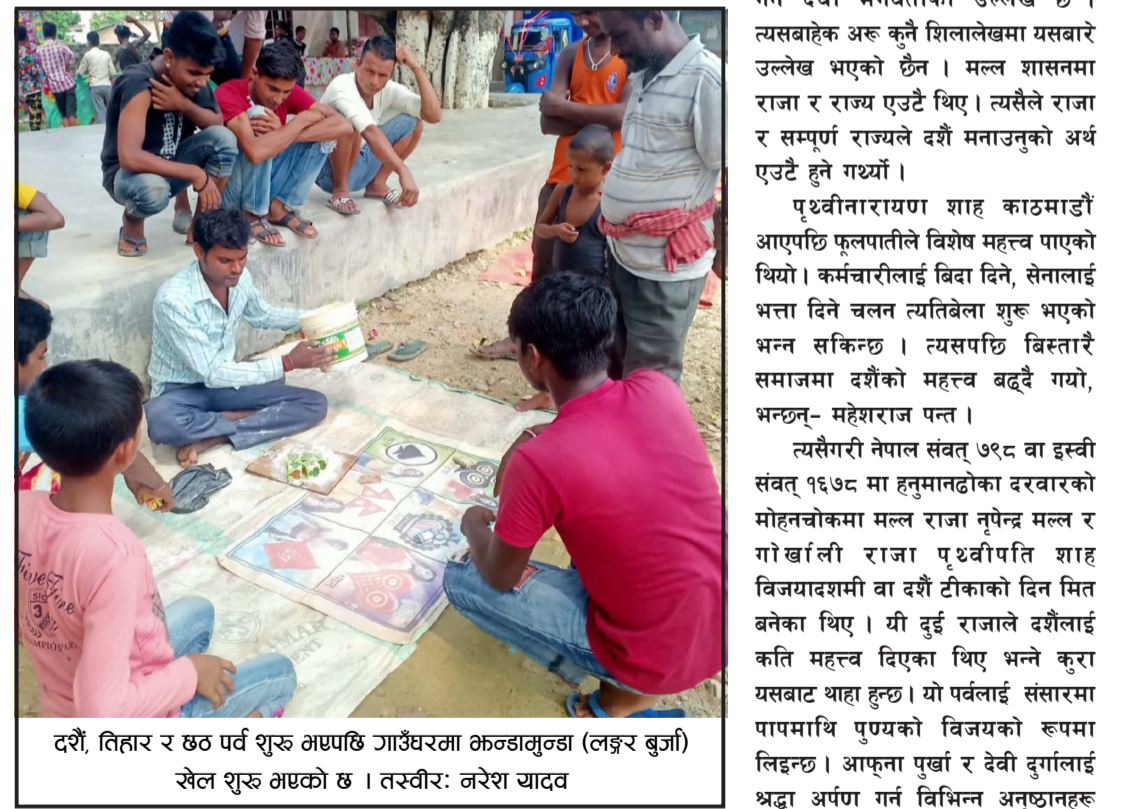
दशैं, तिहार र छठ पर्व शुरू भएपछि जाउँघरमा कञ्जामुन्डा (लङ्गर बुर्जा) खेल शुरू भएको छ।

रहेको उनीहरूले जानकारी दिएका छन्। चलचित्र प्रदर्शनीको शुरूआत गत सेप्टेम्बर २० तारिखमा गरिएको थियो। त्यसको उद्घाटन कश्मीरका लागि भारतका उच्च प्रशासक मनोज सिन्हाले गरेका थिए। सो चलचित्र हलको "मानिसहरूले चलचित्र हेर्ने भनी सोचेको देखिएको छैन, उनीहरू चलचित्रबाट धेरै टाढा पुगेकाले फेरि पहिलेकै अवस्थामा ल्याउन अझै केही समय लाग्न सक्छ, त्यो स्वभाविक हो"- एक स्थानीयले भने। अर्का एक स्थानीयको भनाइ थियो-"चलचित्रबारे आम नागरिकको फरक फरक धारणा पाइन्छ, कतिपयले चलचित्र हेर्नुलाई राम्रो मान्छन् भने कतिपयले गलत मान्छन्, मैले भने यसलाई प्रगतिको सङ्केतका रूपमा लिन्छु।" शनिवारको दिवाकालीन र सन्ध्याकालीन प्रदर्शनीमा कुल सीट सङ्ख्याको १० प्रतिशतभन्दा कम दर्शक आएको पाइएको छ। रासस