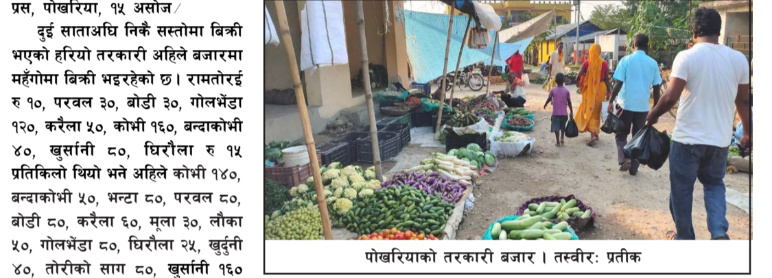
हरियो तरकारीमध्ये अहिले गोलभेंडा मात्र सस्तो भएको छ, पहिले १२० थियो भने अहिले ८० मा झरेको छ। यही मौसममा पाइने तोरीको साग भने अचान्की महँगो भएको छ। अवका केही

प्रस, पोखरिया, १५ असोज / दुई साताअघि निकै सस्तोमा बिक्री भएको हरियो तरकारी अहिले बजारमा महँगोमा बिक्री भइरहेको छ। रामतोरई र १०, परवल ३०, बोडी ३०, गोलभेंडा १२०, करैला ५०, कोभी १६०, बन्दाकोभी ४०, खुसानी ८०, घिरीला र १५ प्रतिकिलो थियो भने अहिले कोभी १४०, बन्दाकोभी ५०, भन्टा ८०, परवल ८०, बोडी ८०, करैला ६०, मूला ३०, लौका ५०, गोलभेंडा ८०, घिरीला २५, खुदुनी ४०, तोरीको साग ८०, खुसानी १६० प्रतिकिलो पुगेको छ। चाडपर्व लक्षित हरियो तरकारी महँगो भएको हो। उत्पादन कम र माग बढी भएपछि हरियो तरकारी महँगिएको हो। दशैमा वर्षा.... गण्डकी, लुम्बिनी र सुदूरपश्चिम प्रदेशका थोरै स्थानमा भारीदेखि धेरै भारी वर्षाको पनि सम्भावना रहेको छ। असोज २० गते एकादशीका दिन पनि देशभर बदली रही थोरै स्थानमा मेघ गर्जन/चट्याडसहित हल्कादेखि मध्यम वर्षाको सम्भावना रहेको छ।