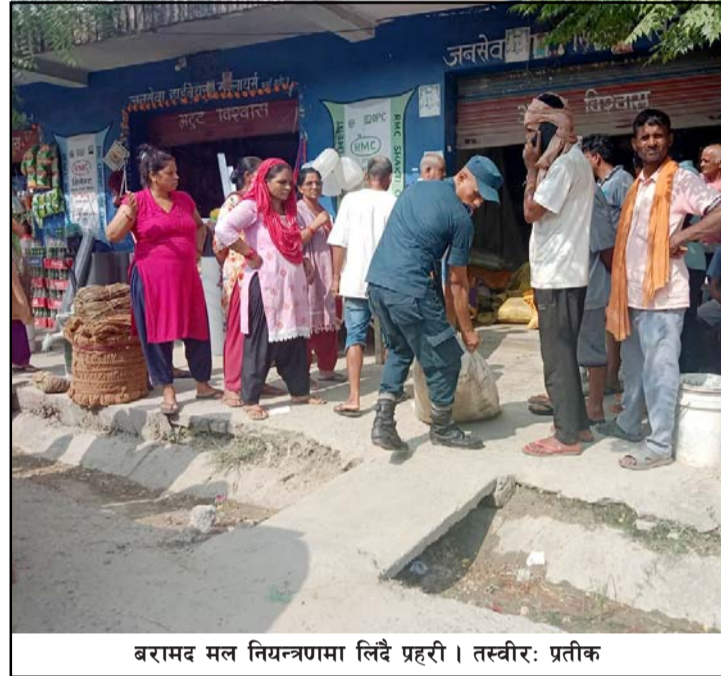
बिरामद मल नियन्त्रणमा लिई प्रहरी ।