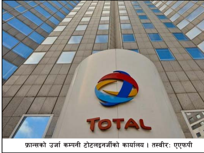
फ्रान्सको उर्जा कम्पनी टोटलइनर्जीको कार्यालय।

यी भण्डारहरू समुद्रमुनि इरानी भूभागमा फैलिएका छन्, जहाँ तेहरानले आफ्नो दक्षिण पार्स ग्याँस क्षेत्रको दोहन गर्ने प्रयासलाई अन्तर्राष्ट्रिय प्रतिबन्धहरूले बाधा पुऱ्याएको छ। दक्षिण कोरिया, जापान, चीन, कतारका एलएनजीका लागि मुख्य बजार बनेका छन् तर गत वर्ष युरोपमा ऊर्जा सङ्कट उत्पन्न भएपछि खाडी राष्ट्रले बेलायतलाई थप आपूर्तिका लागि सहयोग गरेको छ। साथै यसले जर्मनीसँग सहयोग सम्झौताको पनि घोषणा गरेको छ। रासस