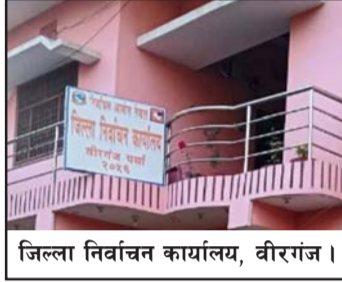
जिल्ला निर्वाचन कार्यालय, वीरगंज।