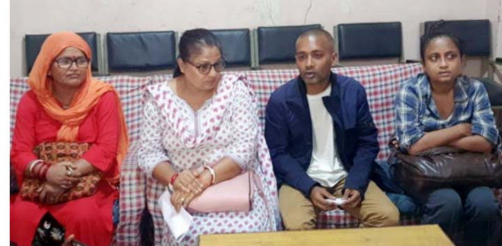
घटनाबारे पत्रकार सम्मेलनमा जानकारी दिँदै।