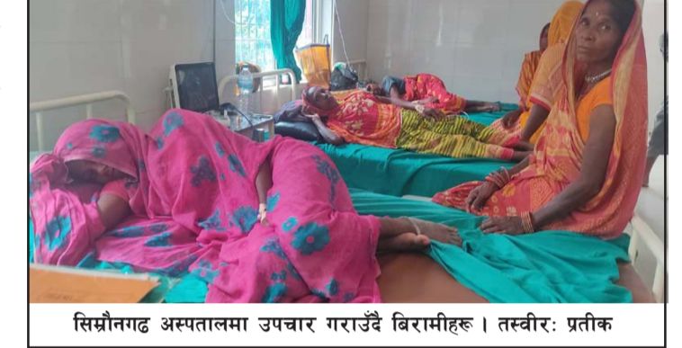
सिम्रौनगढ अस्पतालमा उपचार गराउँदै बिरामीहरू।