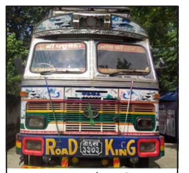
ब्रामद ट्रक।

उनले हाईवेवर र खुद्रा सामान बोकेको ना.५ख ४८३१ नं को ट्रकलाई आदर्शनगरबाट, औषधि र खुद्रा सामान रहेको ना.६ख ३३७३ र ना.७ख ६८७५ नं का ट्रक घण्टाघर र माईस्थानबाट नियन्त्रणमा लिएको र बिलबीजकभन्दा बढी सामान ब्रामद भएपछि आवश्यक कारबाहीको लागि बिहीवार राजस्व अनुसन्धान कार्यालय, पथलैया चलान गरिएको