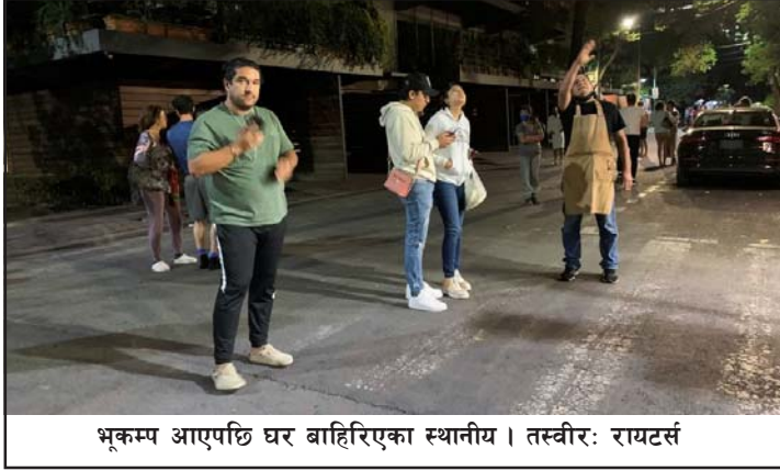
भूकम्प आएपछि घर बाहिरिएका स्थानीय।

राष्ट्रिय भूकम्प विज्ञान एजेन्सीका अनुसार भूकम्प १२ किलोमिटर गहिराइमा रहेको थियो, यद्यपि यूएसजिएसले मेक्सिको सिटीबाट ४१० किलोमिटर टाढा र २४ किलोमिटर गहिराइमा रहेको अनुमान गरेको छ। सन् १९८५ र २०१७ मा गएको दुईवटा घातक भूकम्पको वार्षिकोत्वमा मेक्सिको सिटीमा लाखौं मानिसले आपत्कालीन अभ्यासमा भाग लिएको एक घण्टाभन्दा कम समयमै सोमवारको भूकम्प आएको थियो। रासस