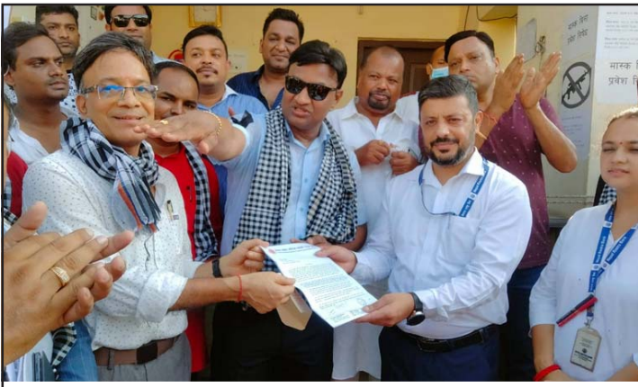
नेराबैंक, वीरगंजका प्रबन्धकलाई ज्ञापन बुझाउँदै उद्योगीहरू ।