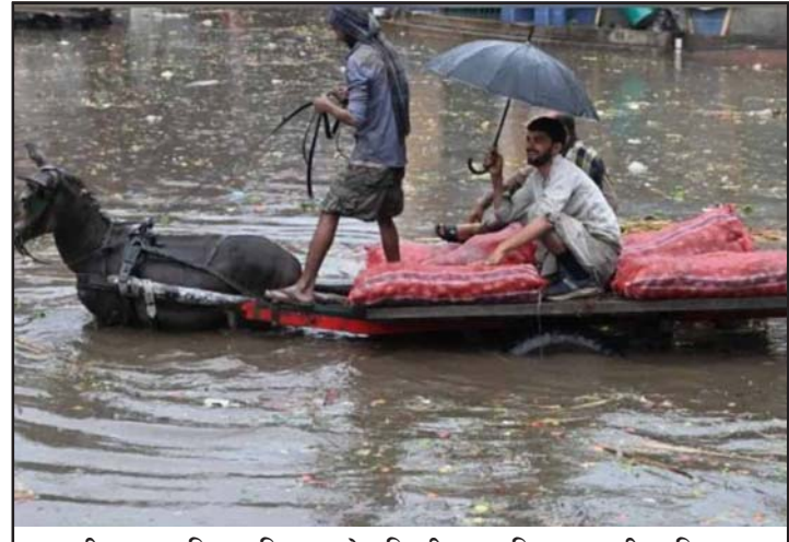
बाढीबाट प्रभावित पाकिस्तानको दक्षिणी प्रान्त सिन्ध।

यस प्रकोपले ५० हजार ९४० घर क्षतिग्रस्त पारेको समाचारमा जनाइएको छ। बाढी प्रभावित क्षेत्रमा प्राधिकरण, अन्य सरकारी संस्था, स्वयंसेवी र गैरसरकारी संस्थाले उद्धार तथा राहत सामग्री वितरणलाई निरन्तरता दिइरहेका छन्। रासस