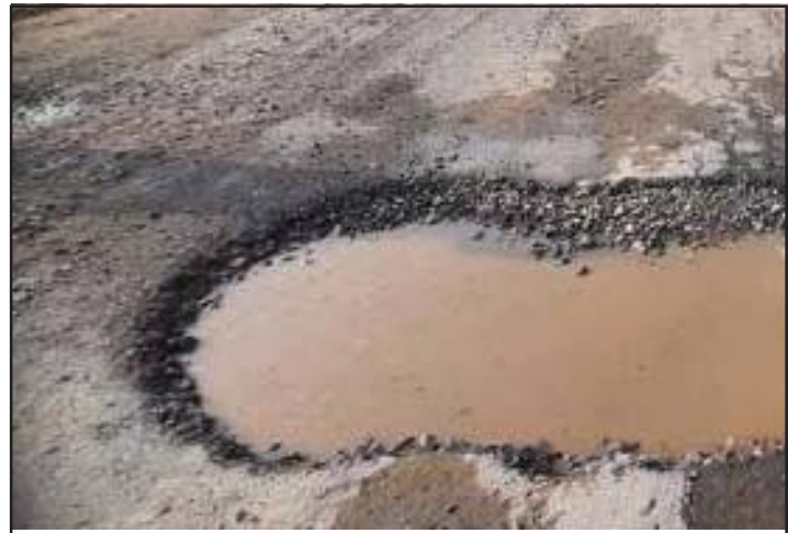
भत्किएको कालोपत्र सडक ।

कालोपत्र (पिच) पकाउँदा दक्ष कामदार भएको बेला ठीक तरीकाबाट पिच पाक्ने