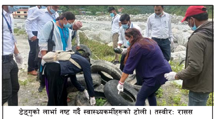
डेङ्गुको लार्भा नष्ट गर्दै स्वास्थ्यकर्मीहरूको टोली।