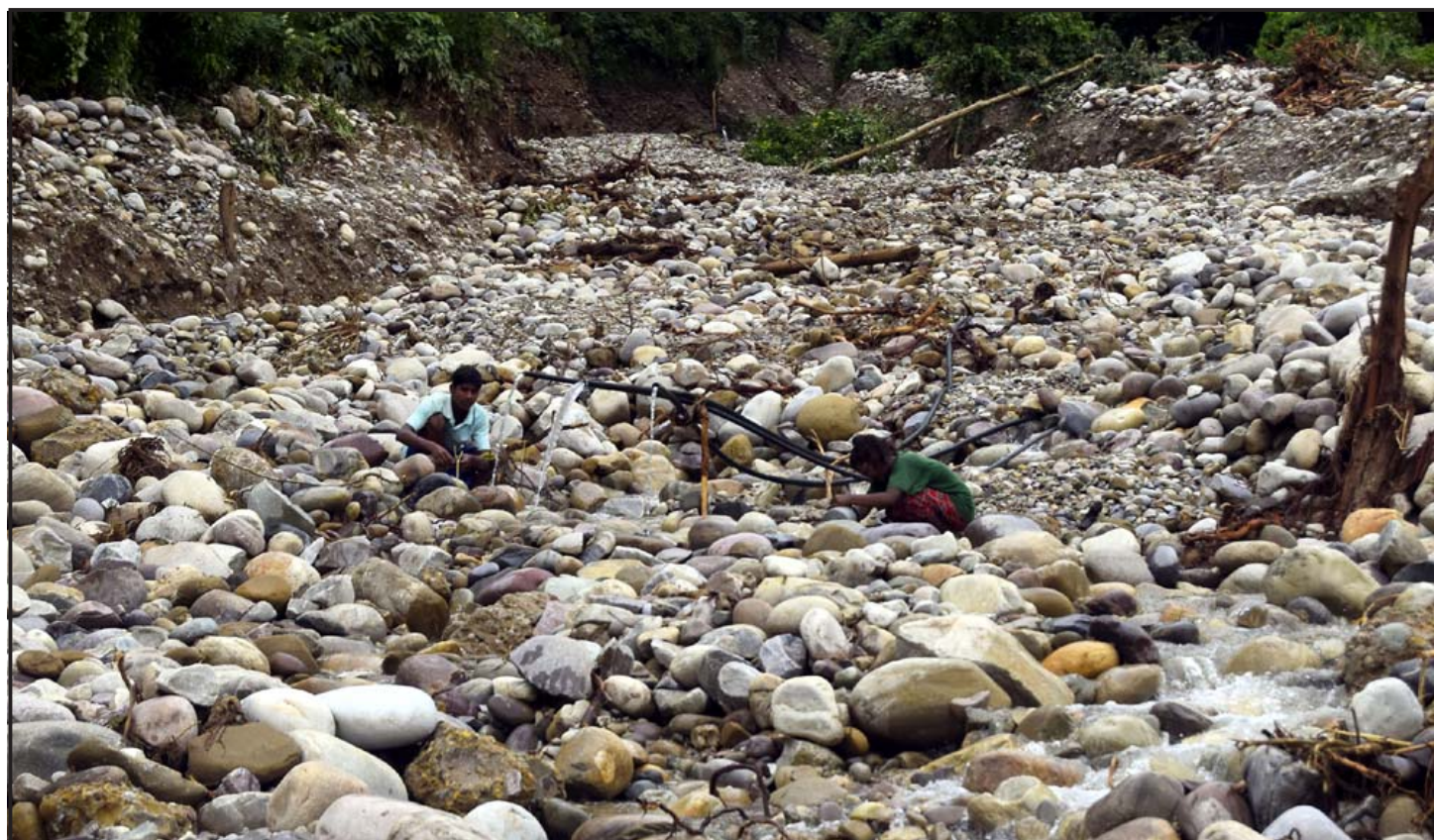
सुर्खेतको पञ्चपुरी नगरपालिका-१०, गल्फामा बाढीले खानेपानीको मुहान बगाएपछि खोला बगरमा पानी भई स्थानीय।