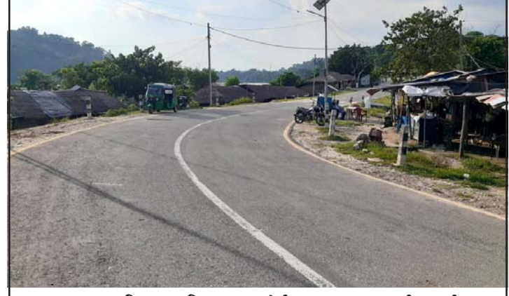
आवागमन बाधित भएपछि सुनसान ठोरी सडकखण्ड ।

अहिले यही विषयलाई लिएर बढेको विवादका कारण भिखनाठोरी भएर (बाँकी अन्तिम पातामा)