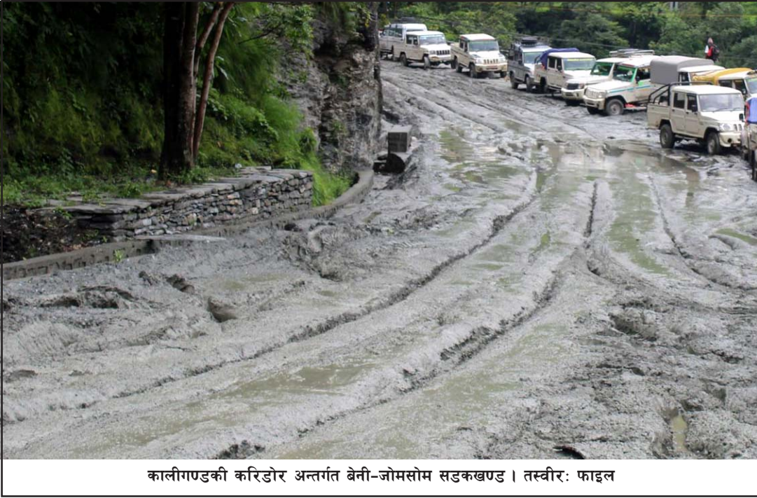
कालीगण्डकी करिडोर अन्तर्गत बेनी-जोमसोम सडकखण्ड ।