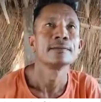
स्थानीय प्रेम श्रेष्ठ।

पशु हाटबजारले बिस्तारै गति लिँदैछ। साताको सोमवार र बिहीवार सञ्चालन हुने पशु हाटबजार अहिले उद्घाटनपछि दुईपटक लागिस्कको छ।