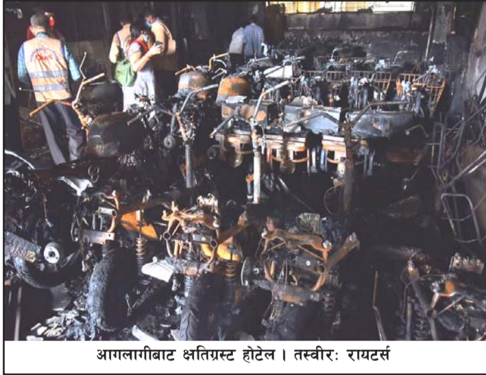
आगलागीबाट क्षतिग्रस्त होटल।

स्थानीय वारुणयन्त्रका एकजना अधिकारीले आठवटा शव होटलको