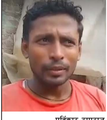
मूर्तिकार रामराज प्रजापतिले बनाएका विश्वकर्मा भगवान्को मूर्ति।

पेशामा संलग्न रहँदै आएका छन्। यसपटक मूर्तिको मूल्य ७०० देखि चार