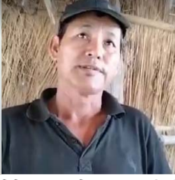
बजार समितिका अध्यक्ष सिलवाल