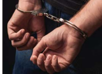
महतो उराव रहेका छन्।

प्रस, बिरुवागुठी, २८ भदौ/ पर्साको राष्ट्रिय वनबाट सालको काँचो रूख कटान गरी गोलिया बनाउँदै गरेको अवस्थामा मङ्गलवार साँझ वन गस्ती टोलीले चारजना काठ तस्करलाई पक्राउ गरेको छ।