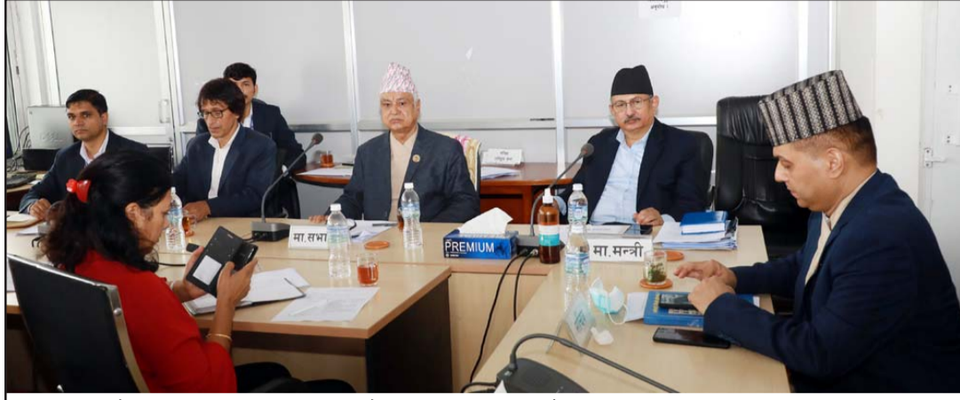
बैठकमा विधेयकमाथि छलफल गर्दै गृहमन्त्री बालकृष्ण खाँणलगायत सहभागीहरू।

गर्नुपर्ने स्वघोषणाले आमाको स्वाभिमान, सम्मान र प्रतिष्ठामा कुनै आँच आउने छैन।' जन्मसिद्धका आधारमा नागरिकता प्राप्त गर्नेको सङ्ख्या हालसम्म एक लाख