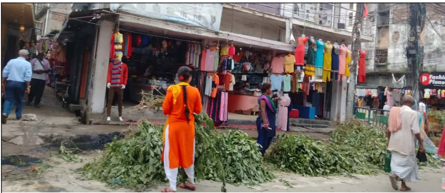
वीरगंज महानगरपालिकाको घण्टाघर र माईस्थानमा बिहीवार भदौ १६ गते ऋषिपञ्चमीको लागि चिचिरो बिक्री भइरहेको छ। बुधवार ठूलो परिमाणमा चिचिरो ल्याएर बिक्री भइरहेको छ। ऋषिपञ्चमीको दिन महिलाहरूले चिचिरोको दतिवन गरेर पूजा गर्ने धार्मिक परम्परा छ।

सवारी नियम उल्लङ्घन गर्ने चालकलाई ट्राफिक प्रहरीले विगतमा झैं सिसिटीभी फुटेजका आधारमा खोजी गरी गर्ने कारबाहीलाई थप तीव्रता दिइएको प्रवक्ता भट्टले बताए। प्रहरीले विद्यार्थी लक्षित जाँच अभियान पनि सँगसँगै अघि बढाएको छ। उक्त अभियानका क्रममा विद्यार्थीले पनि मापसे गरेर सवारी चलाउने गरेको पाइएपछि उनीहरूसमेत कारबाहीमा परेका छन्।