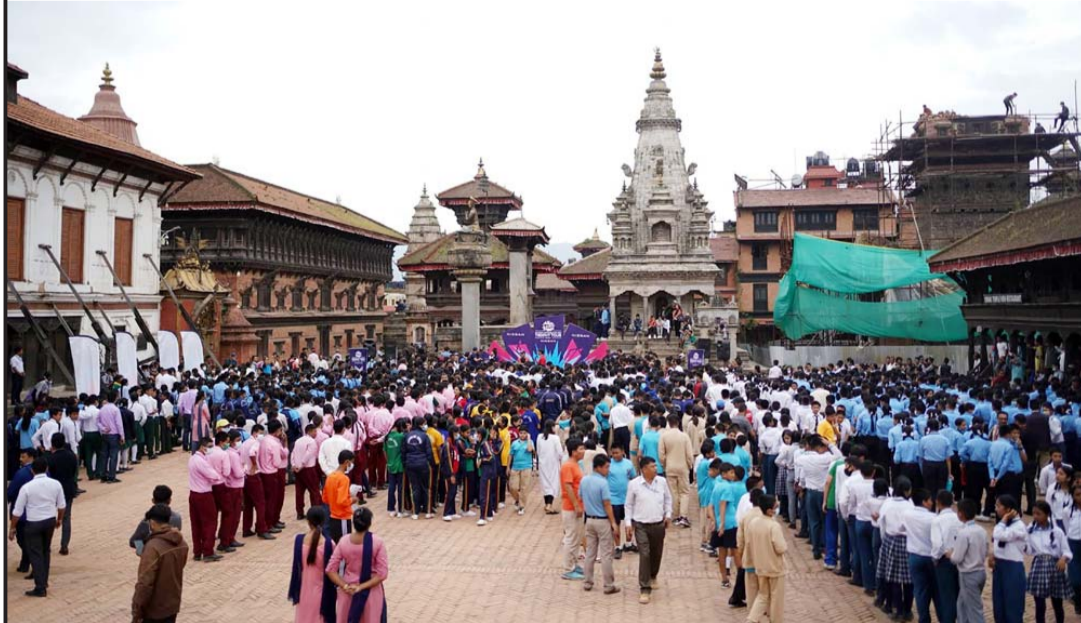
टी-२० विश्वकप क्रिकेट प्रतियोगिताको टुफी भक्तपुरमा : भक्तपुरको दरबार स्क्वायरमा बुधवार सर्वसाधारणका लागि अवलोकनमा राखिएको यसै वर्ष अष्ट्रेलियामा आयोजना हुने टी-२० विश्वकप क्रिकेट प्रतियोगिताको टुफी।