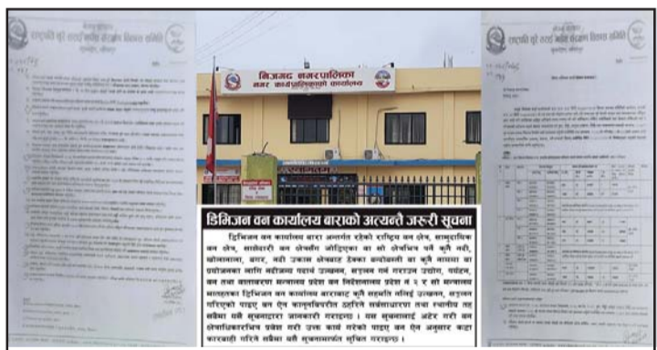
अधिल्लो वर्ष निजगढ नपालाई नदीजन्य पदार्थ ठेक्का बन्दोबस्त र उत्खनन गर्दा कार्यालयन गर्न राष्ट्रपति चुरेबाट दिएको सुझाव र वन कार्यालयले जारी गरेको सूचना ।

एकमात्र निजगढ नपाको प्रमुख आम्दानीको स्रोत नदीजन्य पदार्थको ठेक्का