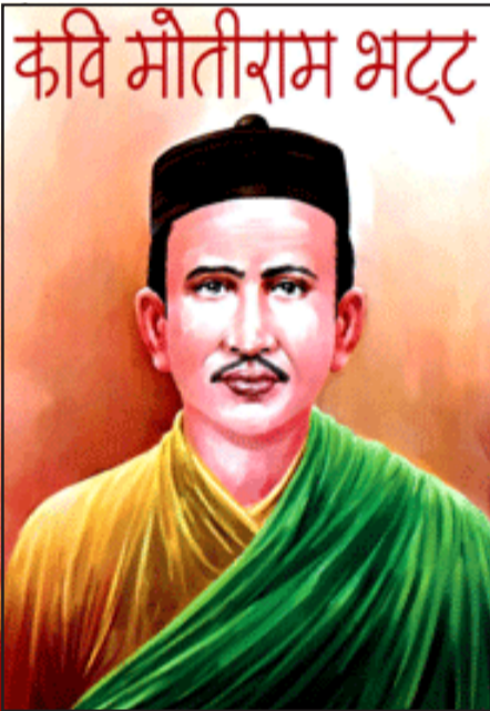
कवि मोतीराम भट्ट

क्षेत्रमा मात्र सीमित थिएनन्। मोतीराम भट्टले नेपाली साहित्यलाई समालोचना, जीवनी, अनुसन्धान, गजलजस्ता अनेक