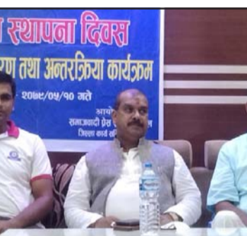
शुक्रबार समाजवादी प्रेस सङ्गठनको प्रथम स्थापना दिवसको अवसरमा आयोजित कार्यक्रममा नगरको शिक्षा सुधार गर्न योजनाबद्ध तरीकाले लागिरहेको बताए ।

देशकै पुराना विद्यालयमध्ये एक गौरको जुद्ध माध्यमिक विद्यालयमा व्यापक आर्थिक अनियमितता भएको आरोपसमेत उनले लगाए ।