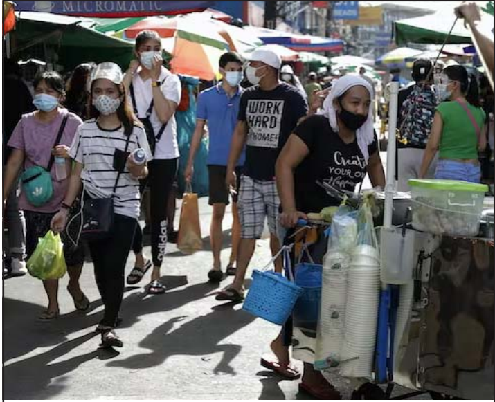
फिलिपिन्सस्थित एक बजारमा मास्क प्रयोग गरि सामान किन्दै ग्राहक ।

सो समयबाट हालसम्म दुई अर्ब दश करोड २४ लाखभन्दा बढी मात्रा खोप लगाइएको छ । भारतमा कोरोना शुरू भएयता हालसम्म ८८ करोड ६० लाखभन्दा बढी मानिसको कोरोना भाइरस परीक्षण भएको जनाइएको छ । रासस