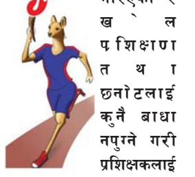
नवौँ राष्ट्रिय खेलकूद-२०७९ पोखरा, गण्डकी प्रदेश