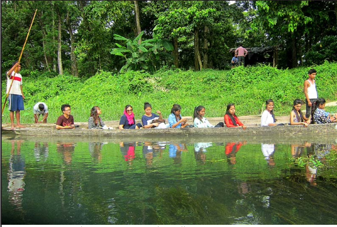
डुङ्गाको सयर: चितवनको सौराहामा डुङ्गामा बसी पानीसँग रमाउँदै आन्तरिक पर्यटकहरू। कोभिड-१९ को महामारीपछि आन्तरिक र बाह्य पर्यटकहरूको आगमनमा कमी हुँदा पर्यटन व्यवसायीहरू मारमा परेका छन्।