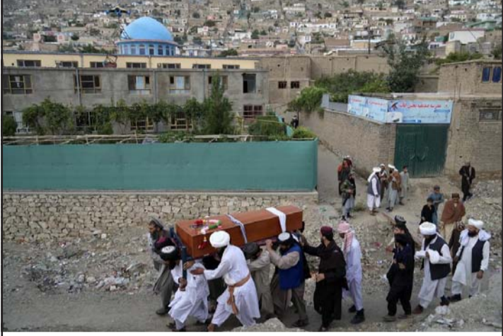
राजधानी काबुलमा भएको बम विस्फोटमा हताहत भएका व्यक्तिको शव ओसारिदै ।

काबुल, २ भदौ/एपी छ । अफगानिस्तानको राजधानी काबुलका प्रहरी प्रमुखका लागि