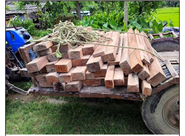
छापामारीबाट प्रहरीले बरामद गरेको काठ।

प्रहरी, स्थानीय जनप्रतिनिधिहरूको सहभागितामा वन कर्मचारी र सशस्त्र