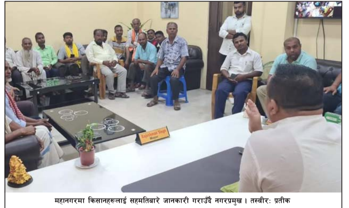
महानगरमा किसानहरूलाई सहमतिबारे जानकारी गराउँदै नगरप्रमुख।

उपलब्ध गराउने सहमति भएको छ। नगरप्रमुख सिंहको नेतृत्वमा हिजो