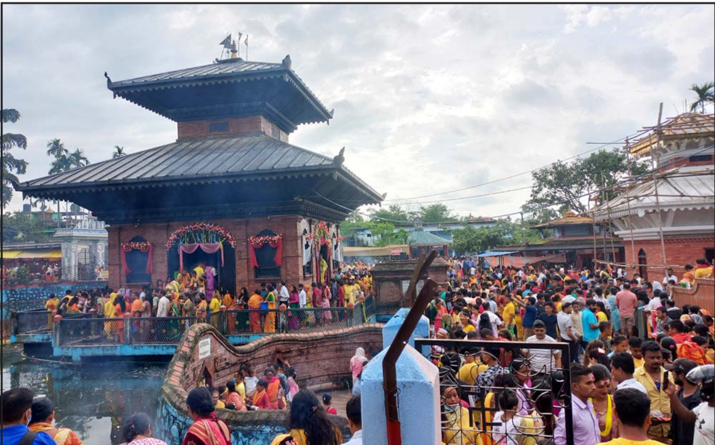
साउन अन्तिम सोमवार कापाको अर्जुनधारा जलेश्वरधाममा भगवान् शिवको पूजा आराधना गर्दै श्रद्धालु मत्तजन।