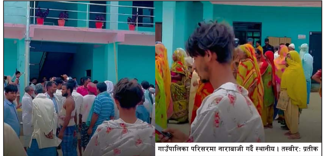
गाउँपालिका परिसरमा नाराबाजी गर्दै स्थानीय।

आफू अहिले काठमाडौंमा रहेको बताए। उनले आफू हालै निर्वाचित भइआएको