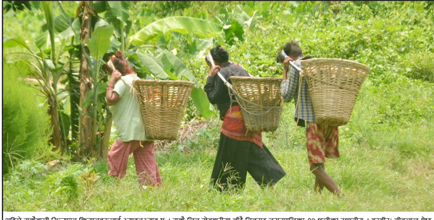
अहिले मकैबाली मित्र्याउन किसानहरूलाई म्याइनम्याइ छ । मकै लिन सेतबारीमा जाँदै निजगढ नगरपालिका-१२ थलीका स्थानीय ।

बाघले आक्रमण गरी घाइते भएको गोहीलाई बाघ भएको स्थाननजिक लगेर राखी खान आएको समयमा बाघलाई नियन्त्रणमा लिइएको हो । यसअघि बाँकेबाट एउटा बाघ यहाँ ल्याइएको थियो । यहाँ खोर खाली नभएपछि बाँके पठाइएको हो । हाल सौरमाहामा दुई र कसरामा दुईवटा बाघ खोरमा छन् ।