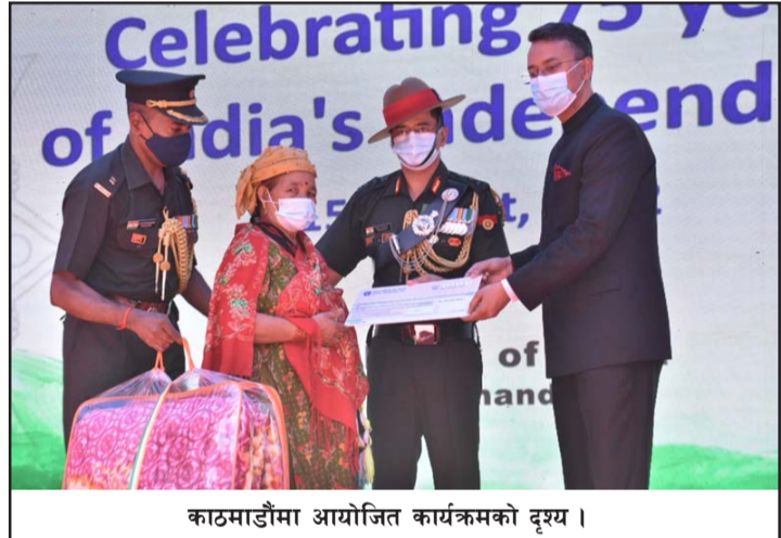
काठमाडौंमा आयोजित कार्यक्रमको दृश्य।