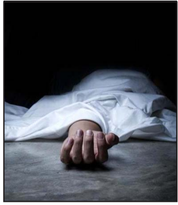
सर्पदंश उपचार केन्द्रमा लैजाने क्रममा दासको मृत्यु भएको थियो।

एक/डेढ घण्टापछि विष फैलिएर असर गर्न थालेपछि उनले घरपरिवारलाई सर्पले टोकेको जानकारी गराएका थिए। उपचारको लागि ठोरी गाउँपालिकास्थित