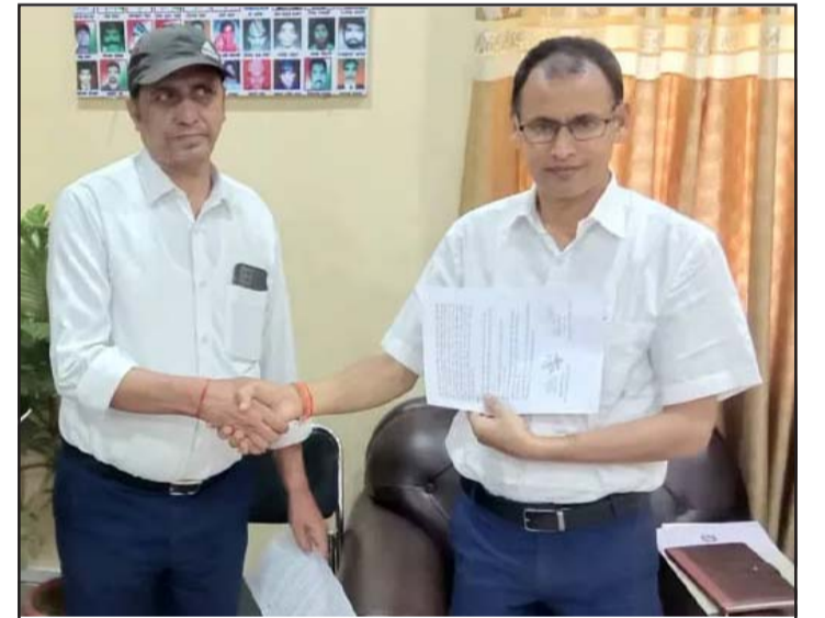
एकअर्कालाई सहमतिपत्र हस्तान्तरण गर्दै महानगरका प्रमुख प्रशासकीय अधिकृत (दायाँ) र कृषि सामग्री कम्पनीका प्रमुख (बायाँ)।

किसानहरूले चार ट्रक युरिया मल नियन्त्रणमा लिएर महानगरको बाल मन्दिरमा राखेका थिए।