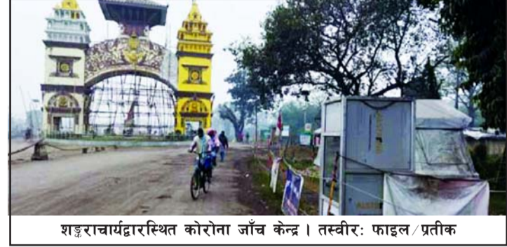
शङ्कराचार्यद्वारास्थित कोरोना जाँच केन्द्र ।

सङ्क्रमणबाट निधन भएको छ । पाँच सयभन्दा बढी सङ्क्रमित भएका जिल्ला काठमाडौं र ललितपुर तथा दुई सयभन्दा बढी सङ्क्रमित भएका जिल्ला कैलाली