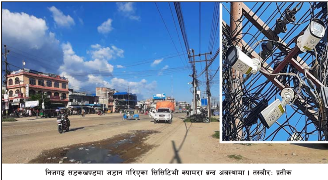
निजगढ सडकखण्डमा जडान गरिएका सिसिटिभी क्यामरा बन्द अवस्थामा ।