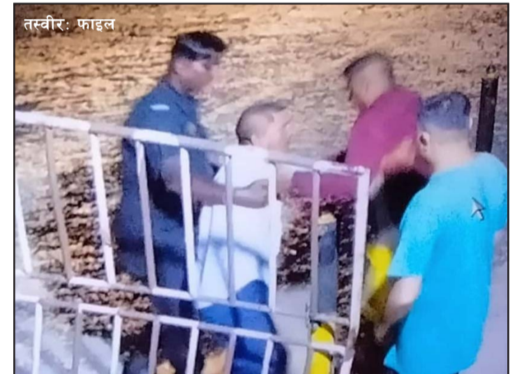
कर्मचारीहरूले मिलेमतो गरी भारतीय गाडीसँग रु एक हजार नजराना लिएर अबेर राति पनि भन्सारको मूलगेट खोल्ने गरेका छन् ।

स्रोतले जनाएको छ । बन्द गेट खुलाउन प्रहरी हवलदार