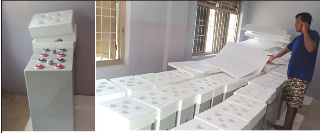
शिकारीबासमा विद्युतीकरणको लागि ल्याइएका सोलार प्यानलहरू ।