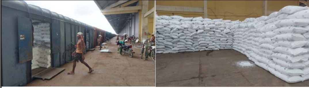
सरकारले ओमानबाट मगाएको एक न्याक मल सुक्खा बन्दरगाह वीरगंजमा बिहीवार आएको छ । सोही मललाई रेलबाट अनलोड गरी गोदाममा भण्डारण गर्दै मजदूरहरू ।