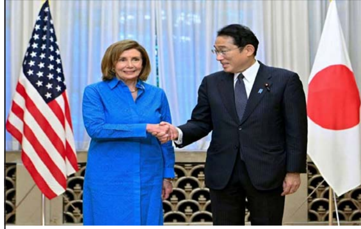
अमेरिकी सदनका सभामुख न्यान्सी पेलोस (बायाँ) र जापानी प्रधानमन्त्री फुमियो किशिदा।

फुमियो किशिदा सरकारले चिनियाँ सरकारसमक्ष कूटनीतिक विरोध जनाइसकेको छ। अगस्त ४ मा चीनले