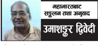
महामारतबाट सङ्कलन तथा अनुवाद उमाशङ्कर द्विवेदी

बाणहरूको वृष्टि गर्न थाले । यतिकैमा अर्जुनले कर्णको पराक्रम हेरेर बडो