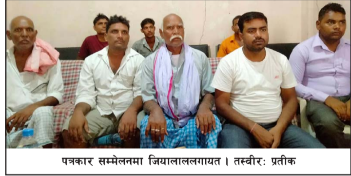
पत्रकार सम्मेलनमा जियालालगायत ।

उनले बैंकको सिसिटिभीमा चेक भान्जाले बुझ्ने र भिनाजु साभमा रहेको