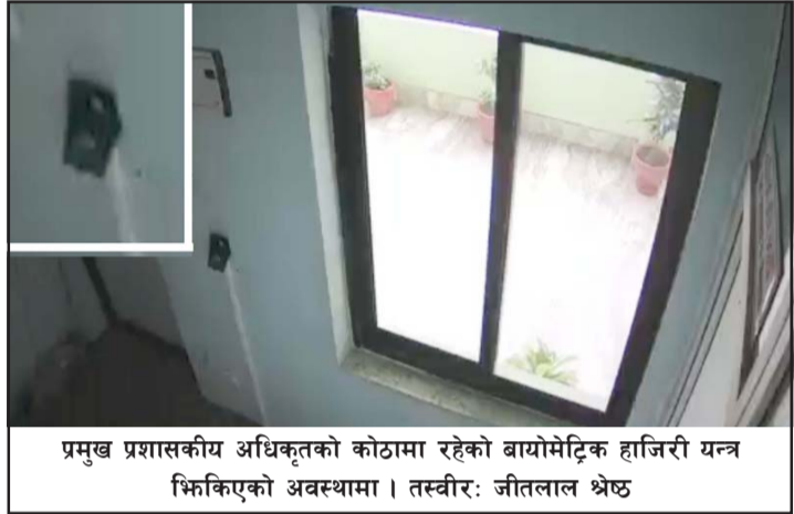
प्रमुख प्रशासकीय अधिकृतको कोठामा रहेको बायोमेट्रिक हाजिरी यन्त्र भ्रिक्तिएको अवस्थामा ।

तानी निजगढ नपामा कार्कीलाई पुनर्बहाली गरेसँगै नेकपा एमालेबाट विजयी भएका